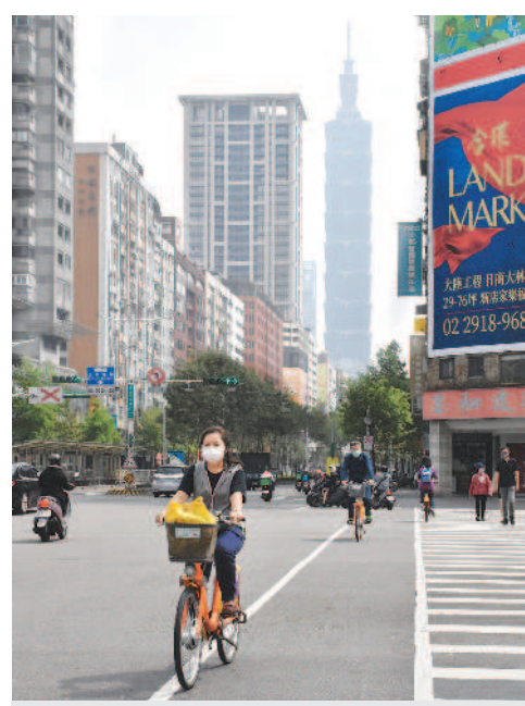
▲昨天西半部空汙嚴重，空氣品質不佳，民眾戴著口罩騎車，雖然臺北市出現陽光，但從遠處看一〇一大樓仍是灰濛濛的一片。