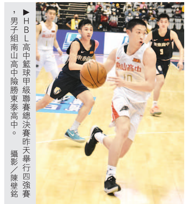
► HBL高中籃球甲級聯賽總決賽昨天舉行四強賽，男子組南山高中險勝東泰高中。