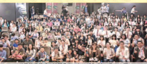
108年愛學網頒獎典禮暨分享工作坊活動 學生總大合照

相關系列徵集活動訊息可於愛學網 ( http://stv.moe.edu.tw/ ) 查詢，並請持續關注最新動態，愛學網將與全國師生共築自發、互動、共好的教育學習理念。