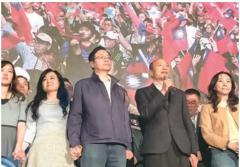
▲總統蔡英文（上圖中）高票成功連任，她發表勝選感言時保證，不會因為勝利就忘記反省。韓國瑜（下圖右二）承認敗選，辜負選民期待，明天將回高雄市政府上班。