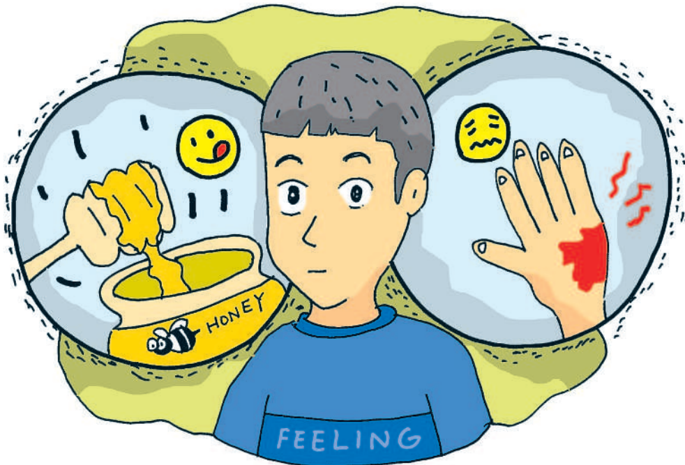
▲人類是唯一有知覺與自我意識的動物嗎？

如果這些通過鏡子測試的生物，也只是在操控鏡中影像，那牠們可能就沒有真正的自我意識。