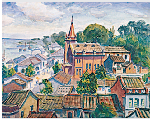
▲倪蔣懷〈淡水教堂〉，北美館典藏。

如此絕美的角度呢？藝術家敏銳的洞察力，在看似平凡的日常裡擷取出最動人的畫面，正如更早之前馬偕博士，能在傳統的馬偕寫生中，注入新知識的活水。那份對人和土地的熱