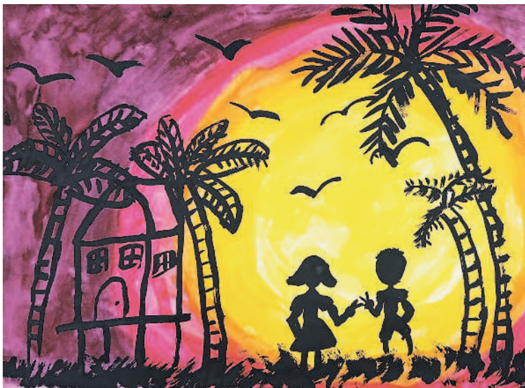
燦爛暮色 王月淳 · 新竹縣上智小學二年B班