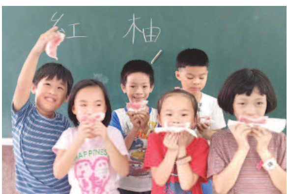
▲品嚐家鄉農產好滋味。

在果園裡，學生還發現蟬蛻，興奮不已。而樹下一堆堆小土粒，則是天牛居住的痕跡。潘先生解釋：「天牛是柚樹最大的敵人，牠們把樹根當作食物，柚子樹會缺乏養分而死掉。」