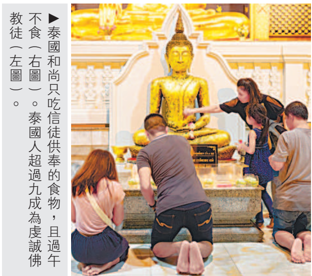
►泰國和尚只吃信徒供奉的食物，且過午不食（右圖）。泰國人超過九成為虔誠佛教徒（左圖）。

不過，也有父母在孩子很小的時候，就把孩子送到佛寺修行。七歲以上、二十歲以下，並接受不殺生、不偷盜、不淫、不妄語、不飲酒、不非時食、不捉持金銀寶物等「十戒」的出家男性被稱作沙彌；年滿二十歲，受持兩百二十七條戒律的出家成年男性則是比丘。