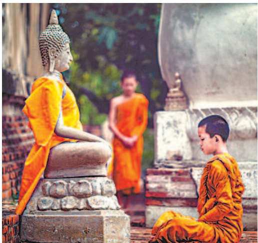
▲泰國父母會把子女送到佛寺修行，成為受十戒的沙彌。

據佛光山網站報導，僧伽醫院經費的來源，主要來自政府補助、社會的樂捐，以及鑄造銅佛的義賣等。