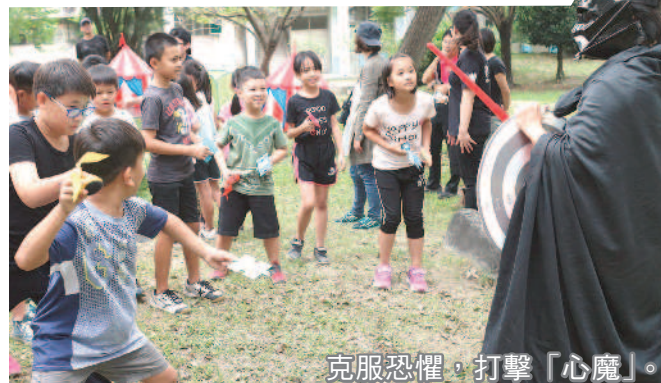
克服恐懼，打擊「心魔」。