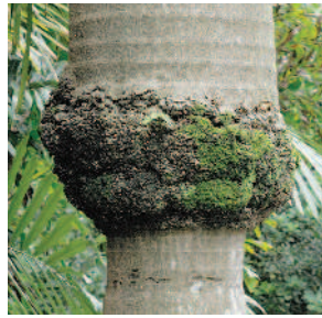
▲大王椰子莖的基部會長出氣生根。

高大挺拔 花果辦不同 誰是臺灣最壯碩的椰子類植物？答案是大王椰子。它有下細上粗的灰白色球棒形樹幹，還在莖的基部長出氣生根，模樣十分特殊。大王椰子也會開花、結果