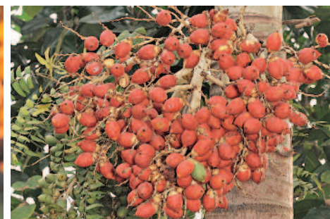
▲聖誕椰子果實鮮紅，也叫紅檳榔。 ◀臺灣海棗的成熟果實可以吃。