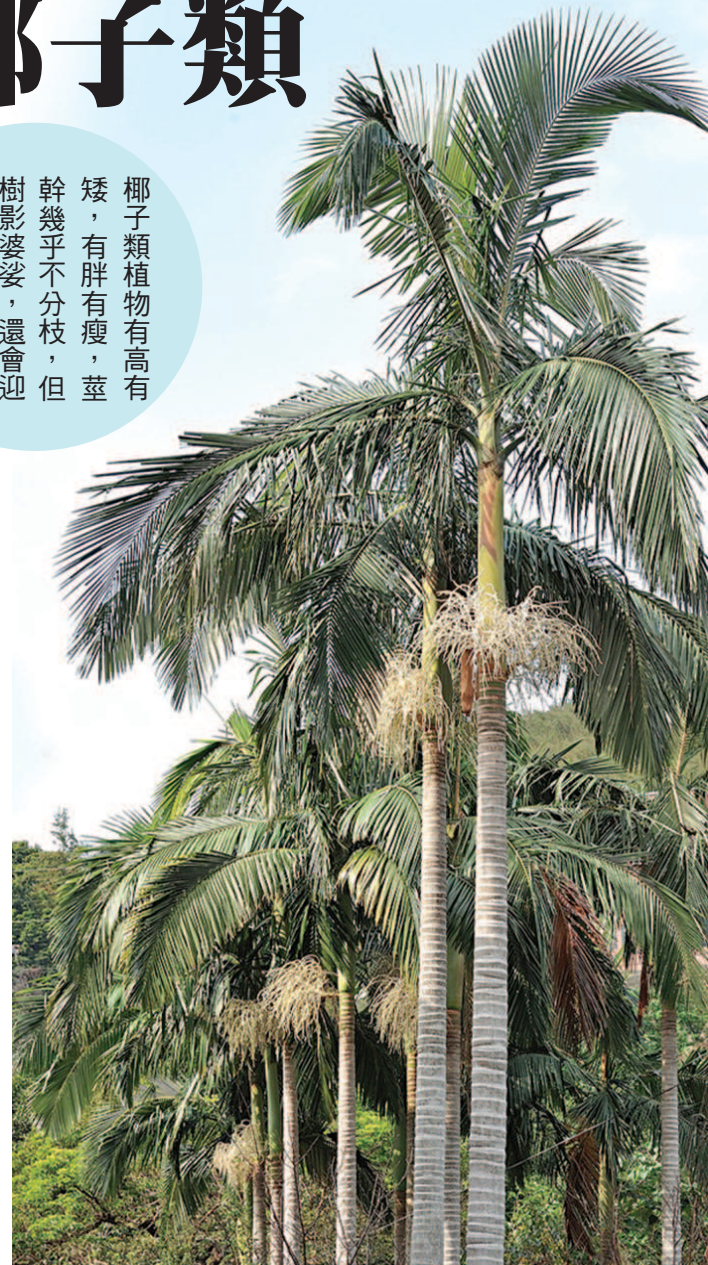
▲亞歷山大椰子是臺灣最高的棕櫚科植物。

椰子類植物有高有矮，有胖有瘦，莖幹幾乎不分枝，但樹影婆娑，還會迎風起舞，所以廣受歡迎。