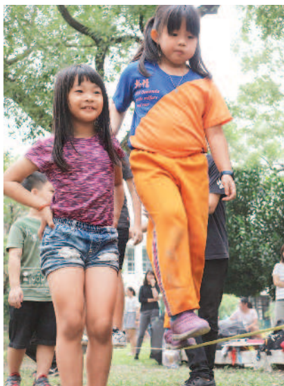
▲扶助走繩，體會友伴支持。 ▼爬蟲洞，克服對黑暗的恐懼。