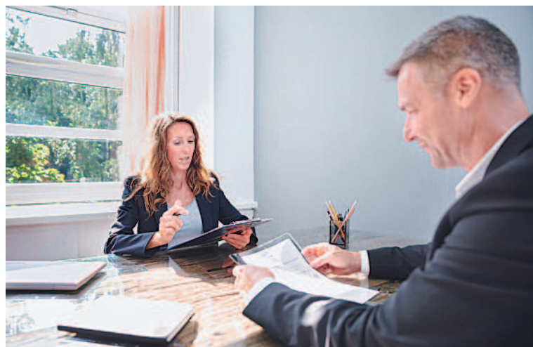
▲男女同工不同酬的職場現象，在各國企業都看得到。

英國在一九七〇年通過《平等薪酬法》，明年將邁入五十年，但法國特協會指出，企業在薪酬上缺乏透明度，令女性無從得知自己薪酬是否過低，也不清楚雇主有沒有違法，無法循法律管道捍衛自身權益。