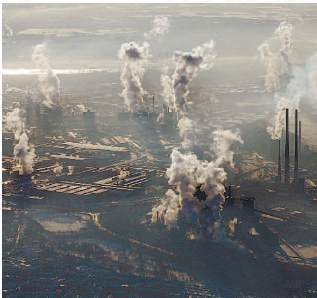
▲二〇一八年全球溫室氣體排放量創下新高，圖為德國鋼鐵工廠排放大量濃煙。

本世紀末達到全球氣溫只升高攝氏一點五度的目標，未來十年每年都要減少排放百分之七點六的溫室氣體。UNEP執行主任安德森表示，從二〇三〇年起，全球每年要少排放一百五十億噸二氧化碳，相當於歐盟、印度、俄國和日本加起來的每年排放量。