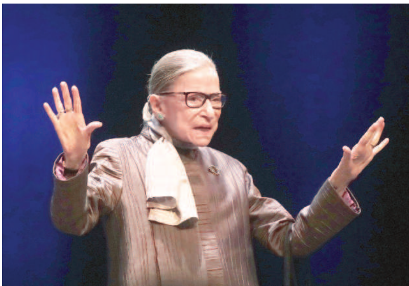
▲積極維護人權和性別平等的金斯伯格，今年十月底在加州大學伯克利分校舉辦的首屆Herma Hill Kay紀念演講，分享她對#MeToo運動的想法。

美國獨立智庫「伯格魯恩研究院」日前公布「二〇一九年哲學和文化獎」，猶太裔美國最高法院大法官金斯伯格（Ruth B. Ginsburg），畢生致力維護人權和性別平等，從五百多名來自不同領域的思想家脫穎而出，她將把獎金一百萬美元（約新臺幣三千零五十萬元）捐給慈善機構或非營利組織。