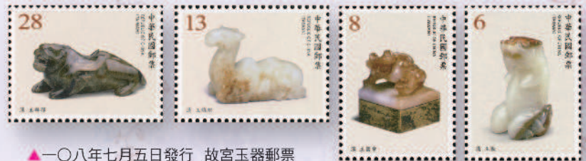
▲一〇八年七月五日發行 故宮玉器郵票

從滾滾媽媽的玉手鐲、小孩胸前掛的玉佩，到收藏家的玉雕擺件，溫潤柔和的玉石，在世人心目中，有著無比美好的喜愛，甚至作為招財、轉運、辟邪的功能。