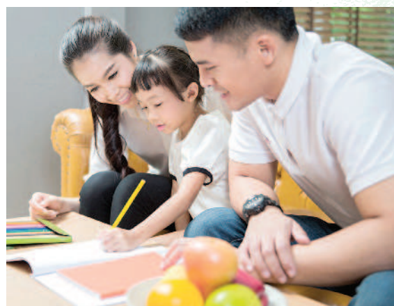
▲爸媽必須討論好教養原則，孩子才不會無所適從。

在媽媽社團中，許多人會不經意的提到，家中某人是扮「白臉」，某人是扮「黑臉」等。久而久之，大家似乎形成某種共識，就是家裡一定要有黑臉、白臉的角色分工，否則教養規矩就很難維持。但真的需要這樣嗎？究竟扮演白臉或黑臉，又會帶來親子關係什麼樣的後遺症呢？黑臉家長也分很多種