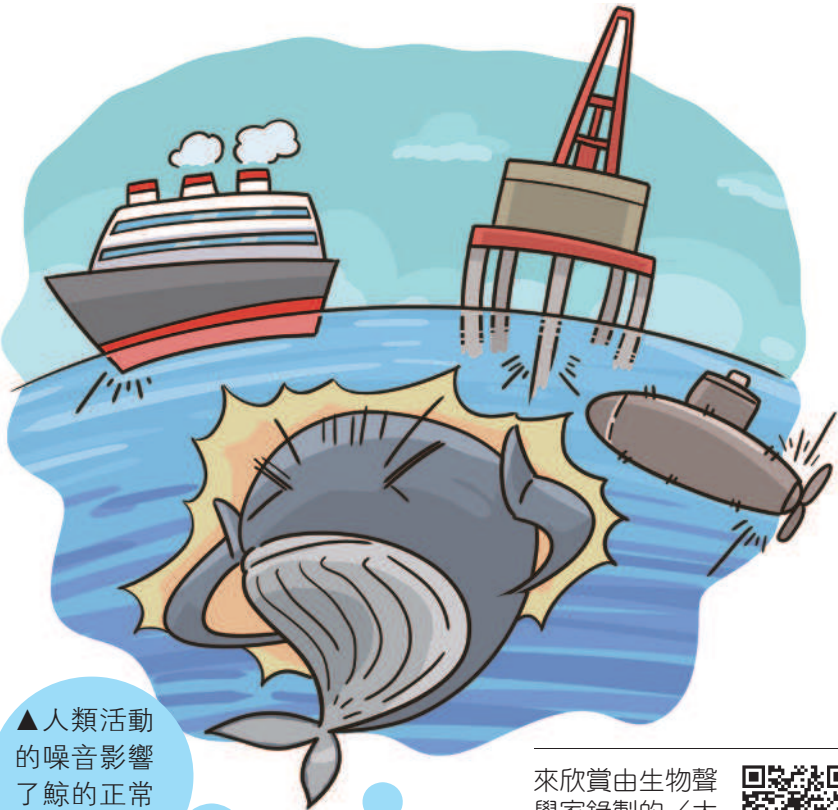
▲人類活動的噪音影響了鯨的正常活動。

直到如今，人們都還未能完全確定公鯨為何而唱，更難預測水下噪音對大翅鯨會有什麼影響。面對海洋多元語言的文化交流，我們得努力保留傳承的可能性，讓溫暖繁殖區的海水中，仍是公鯨引吭高歌的播臺。