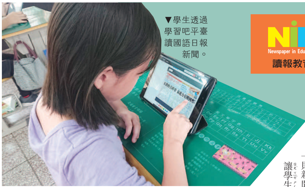
▼學生透過學習吧平臺讀國語日報新聞。