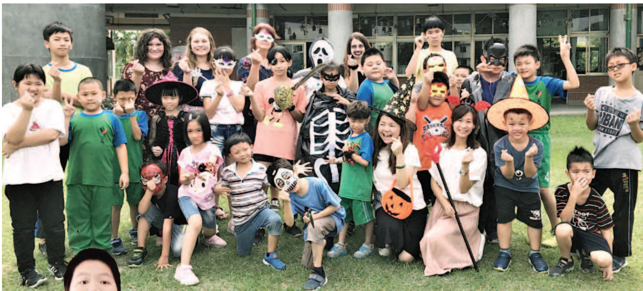
◀◀ 學生與國際志工裝扮萬聖節人物。