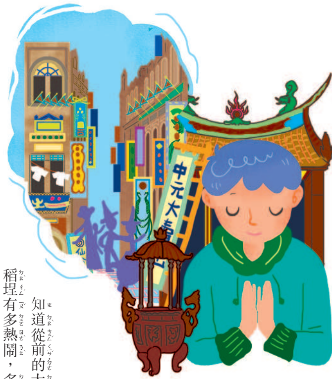
知道從前的大稻埕有多熱鬧，多

從淡水港開港以來，大稻埕就肩負物資轉運的重責大任，運輸和貿易往來帶動了人潮和錢潮，也為大稻埕帶來不同風貌的建築；在現代主義、巴洛克風格與閩南式