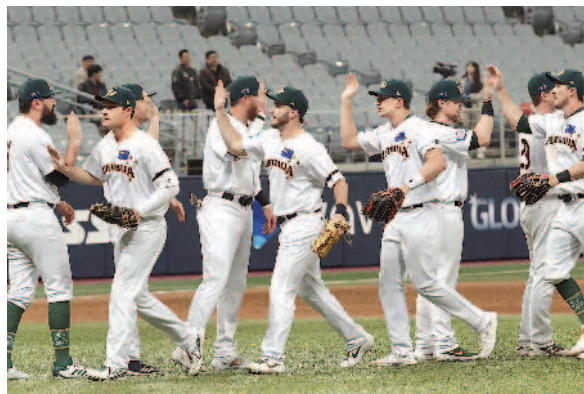
▲澳洲隊在六強複賽成績排名最後。

至於最後一張門票，將於明年初在臺灣舉行的「六搶一資格賽」產生，由各洲第一名以外的隊伍共六隊再戰，爭奪奧運最後一席。