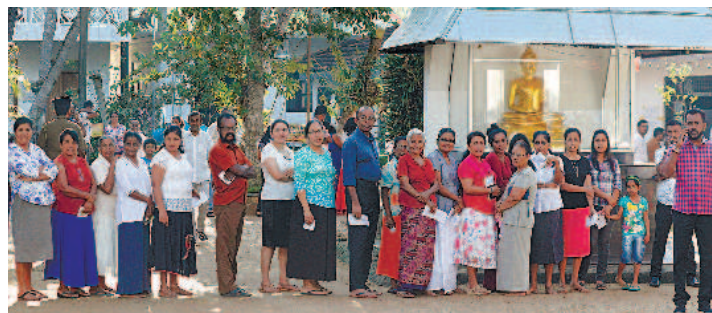
▲斯里蘭卡首都可倫坡的民眾昨天在投票所外排隊等候投票。 文／何靜茹

何靜茹／綜合外電報導 斯里蘭卡昨天舉行總統大選，這次有高達三十五組候選人參選，創下紀錄。現任總統、總理、在野黨領袖都未參選，其中較被看好的兩名候選人戈塔巴耶·拉賈帕克薩及沙吉·普瑞馬達沙都來自傳統政治世家。 斯里蘭卡在今年四月遭逢恐怖攻擊，造成兩百六十九人喪生，因此維安成為選民關注的焦點。昨天有東北部穆斯林選民的車隊遭到暴徒攻擊，目前尚未傳出傷亡報導。 位於南亞的斯里蘭卡，人口約兩千兩百萬人，合格選民近一千六百萬，選舉結果最快可望在今天揭曉。