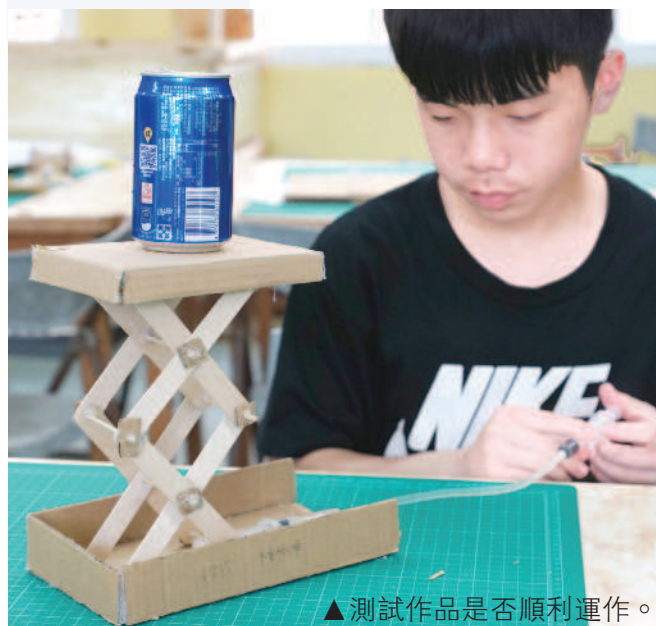
▲測試作品是否順利運作。

為了讓學生有更深入的動手做經驗——實際統整知識、轉化運用技能，懂得與人合作，培養勇於接受挫敗的精神，教師規畫紙板機械設計實作方案。