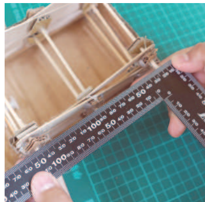
▲正確的數學量測，是部件製作的基础。