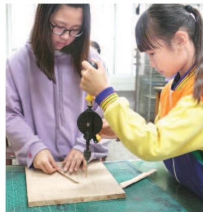
▲小組合作進行零件組裝。