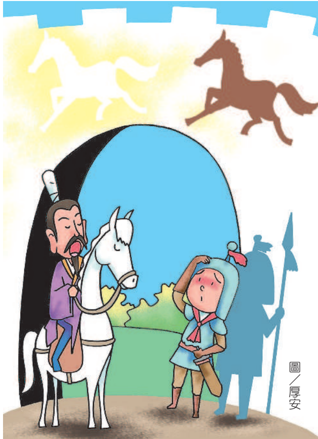
圖 / 厚安

公孫龍和惠施都是中國先秦時期「名家」的代表人物。名家是中國學術發展中很特殊的一個學派，致力於思考法則的研究，相較於同一時期古希臘學者的邏輯研究，同樣精采，不遑多讓。可惜一般人多以「逞口舌之能的詭辯」看待名家的論辯，因此，這個學派在中國歷史上不被重視，逐漸消失。 名家最為大家周知的學說，大概就數《公孫龍子》的「白馬非馬」說。這個學說是有故事的：有一次，公孫龍騎