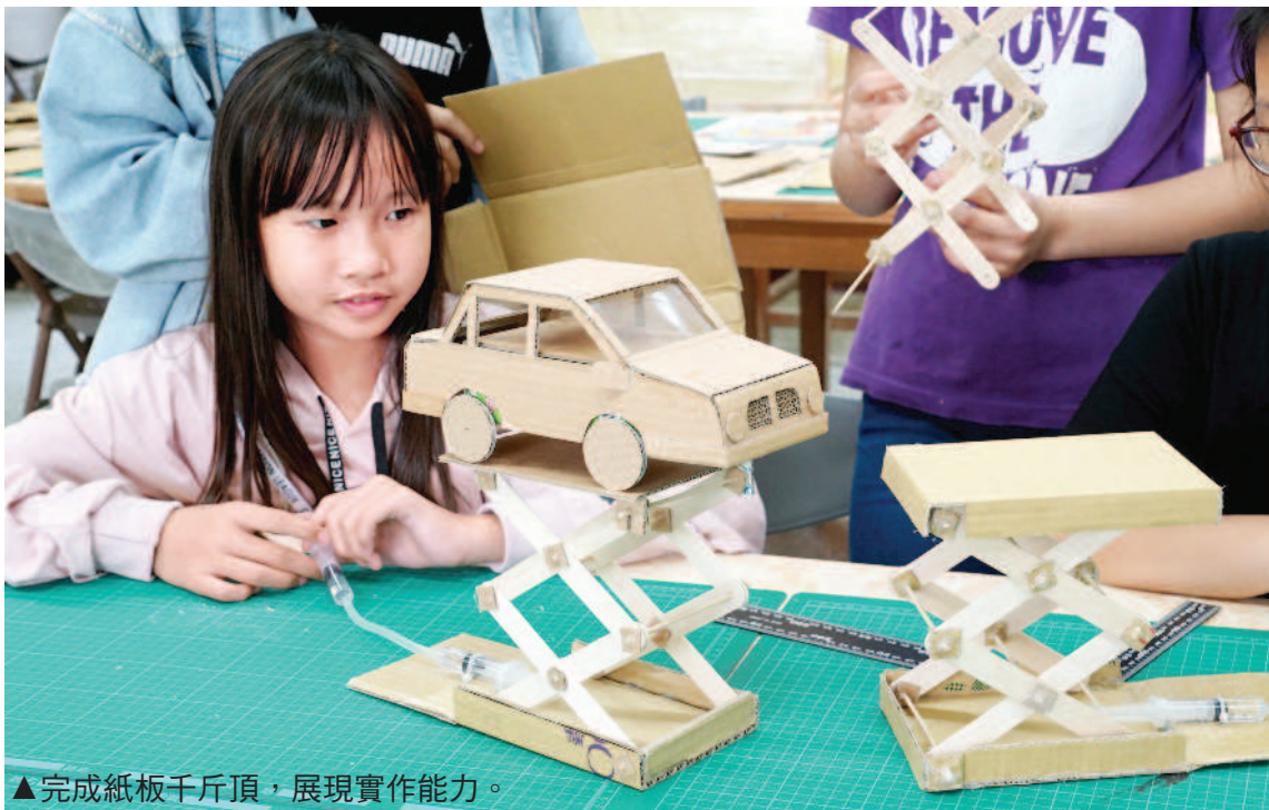
▲完成紙板千斤頂，展現實作能力。