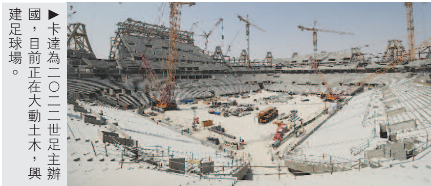
►卡達為二〇二二世足主辦國，目前正在大動土木，興建足球場。

卡達為承辦本屆田徑世錦賽，興建了高級豪華的體育場館，但觀眾席總是空蕩蕩。此外，卡達在二〇一五年主辦世界手球錦標賽，二〇一六年主辦世界自由車公路錦標賽，觀眾人數也都偏少。觀眾參與程度和選手表現常常是相輔相成，二〇二二年卡達主辦世界盃足球賽，能否成功吸引觀眾進場看球，因此也成為輿論焦點。卡達最近和沙烏地阿拉伯、埃及、巴林及阿拉伯聯合大公國交惡，且遭上述鄰國切斷直接交通管道。卡達當局期許藉由世足賽吸引世界注目，不過，他們在行銷方面似乎還未有很多想法，國際足總已要求卡達當局儘快說明門票銷售計畫，以及他