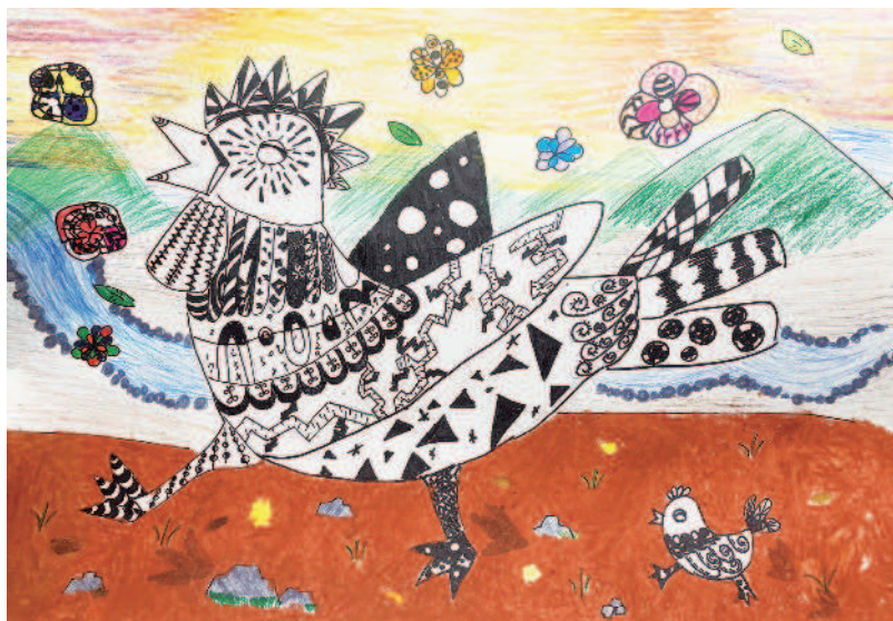
好神氣 闕居寧·臺北市內湖區南湖國小五年六班

當工作人員宣布風速在標準範圍內時，我終於放下心中的大石頭。 大家吃力的爬進大大的籃子裡，等待熱氣球升空。 熱氣球緩緩飛越山谷，剛開始我很害怕撞上山壁。領隊說工作人員都經過嚴格訓練，我才放心的欣賞高空風景。 桃樂絲陰錯陽差錯過熱氣球起飛時刻，不知道回鄉後的她有沒有再坐過熱氣球？而我還會再來，繼續下一趟熱氣球之旅。