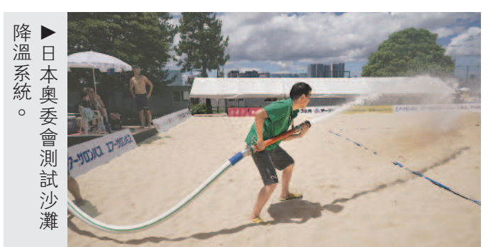
►日本奧委會測試沙灘降溫系統。

工作，另一項重點則是針對日本夏日的高溫高溼，提出因應措施，讓選手盡情發揮實力，觀眾舒適的觀賞賽事。日本將在馬拉松賽道沿途種植有遮陽效果的植物或搭建遮陽板，並有助反射紅外線、可降溫的建材來鋪設賽道路面。另外，東京奧運主場館新國立競技場雖不設冷氣，但會設置一百八十五部巨型風扇、八個噴水霧降溫系統，預估能使體感溫度下降攝氏十度。籌備委也曾於九月測試人造雪，不過，這項設計主要目的並非降溫，而是想讓觀眾在視覺上產生清涼有趣的感覺。