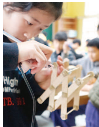
▲各種工具的使用難不倒學生。