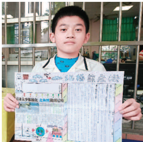
▲ 展示圖文並茂的剪報作品。

教師也會針對新聞議題，讓學生深入分析新聞背後值得探討的議題。像是巴拿馬與我國斷交事件，讓學生認識巴拿馬在全球經濟、交通與政治上占