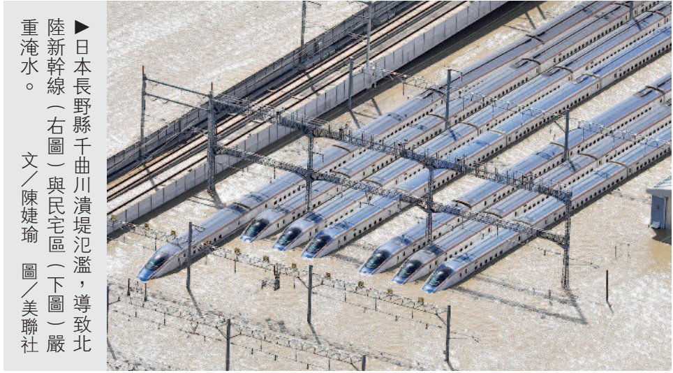
日本長野縣千曲川潰堤氾濫，導致北陸新幹線（右圖）與民宅區（下圖）嚴重淹水。文 / 陳婕瑜

颶風哈吉貝於日本十二日晚間七點，從靜岡縣伊豆半島登陸，導致日本多處下起破紀錄的大雨 根據日本放送協會（NHK）統計，哈吉貝已造成至少十八死、一百二十八傷及十六失蹤；包括關東甲信及東北地方共有十四條河川因大雨氾濫，導致多處嚴重淹水，自衛隊出動直升機救援受困民宅的居民。 哈吉貝也癱瘓陸空交通，有八百一十八個國內航班停飛，一百二十節北陸新幹線車廂因泡水而暫時無法復駛。北陸新幹線造價約新台幣九十億元，日本鐵道專家說，這些車廂 日本首相安倍晉三昨天下令，成立緊急災害對策本部（緊急救災小組），派遣蒐集資訊的小組前往長野縣、福島縣。兩萬七千名自衛隊投入救災，之後會視情況需要，機動性加強救災體制。