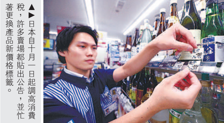
▲日本自十月一日起調高消費稅，許多賣場都貼出公告，並忙著更換產品新價格標籤。

兩度延後的日本消費稅調漲案，終於在十月一日確定實施，由百分之八升到百分之十。日本政府打算將增加的稅收用於償還債務和充實社會福利費，但外界擔憂，這一次與之前調高消費稅一樣，可能衝擊消費市場和經濟景氣。