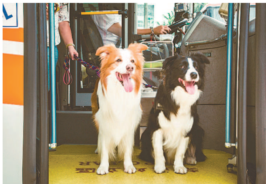
▲臺北市公運處今年針對之前試辦的「假日友善狗狗公車」路線實施增班，並新增五條試辦路線，提供中大型犬免提籠，只需繫繩就能上車。

現行大眾運輸工具臺北捷運、臺鐵、高鐵都規定，警犬、導盲犬外，其餘動物乘車，需裝於一定尺寸寵物箱、寵物車、容器內，但寵物箱尺寸只適用於小動物、小型犬。如臺鐵規定：「攜帶貓、狗、兔、魚蝦類等寵物裝入長四十三公分、寬三十二公分、高三十一公分以下的寵物箱、袋內，且包裝完固、無糞便漏出之虞，放置於座位下得攜帶乘車。」 民眾在國發會平臺的提案提出五點建議，包括寵物推車可上車，限定最大尺寸（大型犬可入），且寵物不落地，不離開推車，會吵鬧者須戴口罩；寵物搭乘鐵路運