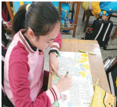
▲ 認真書寫讀報心得。