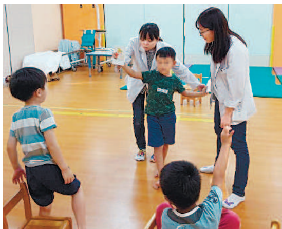
◀▲臨床心理師利用圖片設計遊戲，幫助早療兒童學習揣摩情境和人際互動。