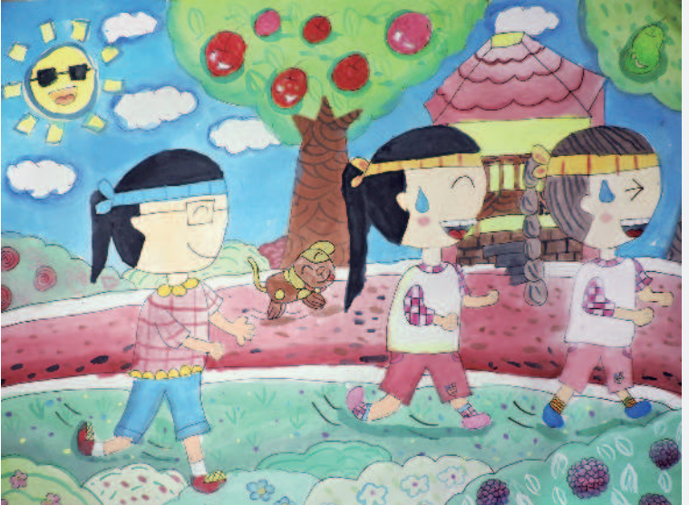
跑步有益健康 江語婕 · 宜蘭縣成功國小四年一班

下課鐘好像有魔法，只要它一響，立刻把靜謐校園變成嘈雜的菜市場。下課鐘響起，教室瞬間變成操場，同學化身短跑選手，生怕腳步慢一點就輸了比賽，可惜他們永遠跑不到終點，因為總會被老師制止。不少同學拿出直笛，此時教室變成展演廳。有的人吹出悅耳曲調，有的則施展穿腦魔音。 上課鐘無情宣布，認真學習的時間到了。大家踩著沉重步伐回到座位。如果下課時間和上課時間一樣長，那該有多好哇！