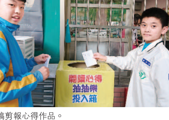
▲ 投稿剪報心得作品。

值得一提的是，學生會剪輯《國語日報》樂學版上內壢國中的閱讀活動，再寫下心得投稿。學生看到學長姐或同學的活動在報紙刊出時都很羨慕，因此在校內進行閱讀課程或活動時，都格外起勁。學生討論說：「看了〈城鄉共學 走進深入在地文化〉，也想參加像這樣的活動，走出戶外讓學習的方式更多元，不僅有趣，還學到有意義的知識。」