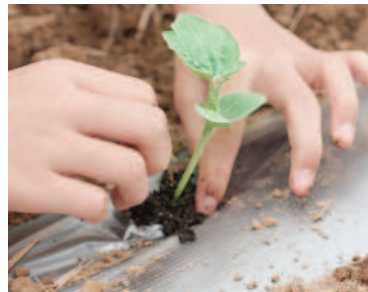
▲小心翼翼種下幼苗，再用木麻黃來防風。

採收季節；今年梅雨下得多又急，西瓜收成比往年少。重返西瓜田，田園老師教導學生判定西瓜成熟度，以及摘採技巧。因為施行有機農法，不噴灑農藥、除草劑，只使用菌類和酵素進行蟲害防治，所以學生得在一片雜草之中尋找成熟的西瓜。