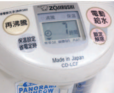
▲運用「省電定時」功能鍵，就可在睡眠時停止通電加熱。

如果電熱水瓶使用的頻率不高，也可以考慮在夏季期間讓它先休息。可以將水煮滾後放入保溫瓶，依舊有溫熱水可用。或者需要沖泡飲品時，改用快煮壺燒點熱水就可以了。