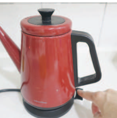
▲夏日不常喝熱水，需要時再用快煮壺燒開水更省電。