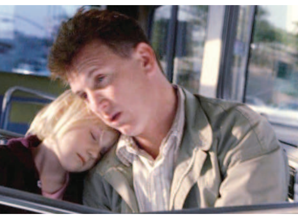
▲山姆與露西的父女情深讓人感動。

教導的古老智慧，指引辛巴走上正確的人生方向，也賦予他責任感和勇氣。當辛巴感到寂寞無助時，他知道自己永遠不孤單，因為在天堂的父親，永遠會守護他。