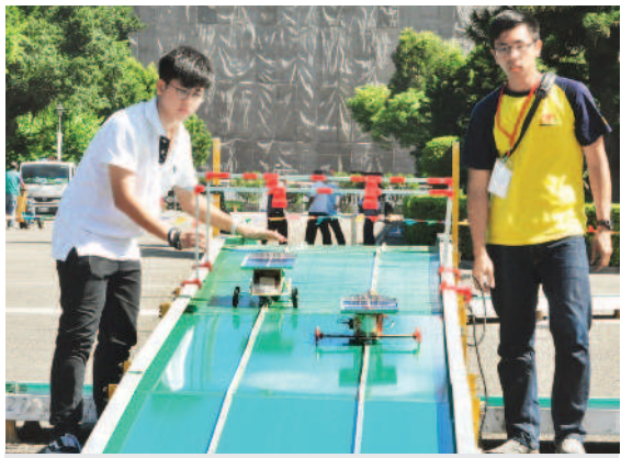
高中職太陽能模型車競賽登場 全國高中職學生太陽能模型車競賽昨天在國父紀念館進行。初賽共有二十四隊晉級，昨天的總決賽，以面試、製作影片和競速成績做為最後總評分。圖為選手分批測試太陽能車，看誰的跑最快。 報導·攝影 / 陳壁銘

新竹市自一百零五年試辦「緊急救護車輛優先號誌示範計畫」，在消防局三民分隊消防車出口，建立出勤時改變附近街道燈號的按鈕。竹市交通處科長林立偉說，確實有效避免回堵，因此續辦至今。至於新竹市未來是否擴大辦理？林立偉回應，之前其他縣市試辦救護車輛加裝燈號變換偵測設備，但無特別成效，已取消相關措施，不過仍可研議。