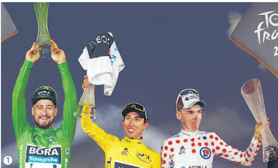
1 薩甘（左）獲得最佳衝刺車手的綠衫，貝納爾（中）穿上象徵冠軍榮耀的黃衫，巴爾德特（右）則拿到最佳登山車手的紅點白底衫。 2 貝納爾（前）與隊友湯瑪斯（後）抵達巴黎香榭大道終點線。 3 湯瑪斯（右）祝賀貝納爾（左）獲得總冠軍。