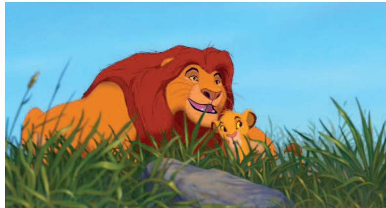
▲獅王木法沙帶領小王子辛巴了解自然法則。

木法沙是充滿智慧又勇敢慈愛的父親，被覬覦王位的叔叔刀疤謀殺後，雖然無法陪伴辛巴長大，但他