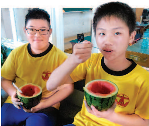
▲自己種的西瓜最好吃。

苗栗縣後龍鎮的農產有三寶：西瓜、地瓜與花生，而大山國小所坐落的灣寶社區向來以「甜美西瓜」頗負盛名，西瓜更是孩子與自己家鄉連結的重要經濟作物。因此，大山國小結合在地的「良食」生產小農，規畫一系列「甜美」的戶外學習課程，讓學生了解西瓜的有機栽培與環境永續的重要關係。