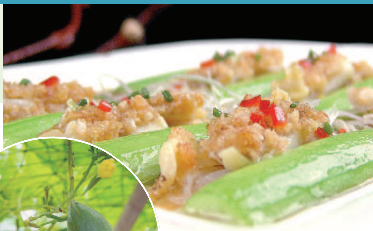
◀▲新鮮的絲瓜光是清炒就甜美無比。