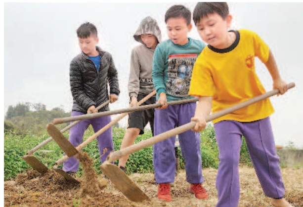
▶拿鋤頭鬆土真辛苦。