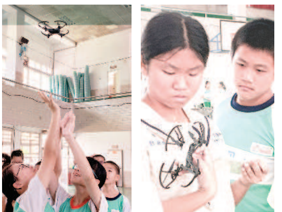
▲體驗操作無人機，思考如何活用科技。

走進烹飪教室，學生都躍躍欲試。製作流程是：用刀子將酥皮切成四等分，再於酥皮四角各切一刀，往內包住牛奶糖，最後抹上蛋液，送入烤箱烤十分鐘就完成。不少學生第一次拿菜刀，從觀察、摸索中學習正確使用刀具。切酥皮、摺造型、抹蛋液，同組學生分工合作。餅乾送入烤箱後，學生開始清洗菜刀、砧板和盛裝容器，再清除桌面殘留的蛋液，做垃圾分類回收。這些看似簡單的工作，都是家政教育重要的一環。官方拿著自製餅乾開心的說：「這堂課很實用，假日我要做給家人享用。」