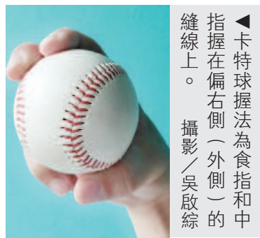
卡特球握法為食指和中指握在偏右側（外側）的縫線上。

卡特球 (cutter)，又稱切球，它介於直球與滑球之間，球速比滑球快，變化幅度則不如滑球，是前洋基隊終結者李維拉招牌球路。李維拉的卡特球球速可以達到時速約一百五十三公里，進壘時會往右打者外角快速偏移，打者不易抓住擊球點，常揮棒落空，左打者在揮棒時甚至容易傷到手指，加上它的球速與直球接近，打者難以分辨球種，與直球搭配可達到欺敵的效果，多次名列美國大聯盟十大魔球之首。 至於握法，以右投手而言，將食指和中指握在比較偏右側（外側）的縫線上，其他投球的姿勢、甩動手臂的方式和直球一樣。目前大聯盟勝場數第二多、防禦率最低的道奇隊、南韓左投柳賢振，除了精準的控球外，也善用「卡特球」，特別用來對付右打者，讓他的戰績扶搖直上。