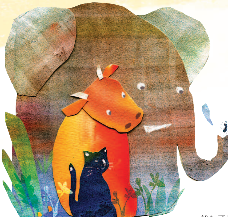
圖 / 盧貞穎

這隻螞蟻原來的名字人們忘記了。現在，他的名字叫「很厲害」。 那天他看了一本雜誌，雜誌裡的文章說螞蟻可以舉起比自己重一百多倍的重物，所以很厲害。