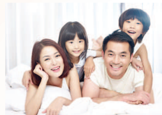
▲和諧的家庭氣氛需要夫妻倆攜手共同創造。

「這個門是怎樣，為什麼沒有關好？講了八百次都做不好！」爸爸又對媽媽口不擇言的開炮，大女兒剛好識相的溜回房間，因為她知道這只是開端。