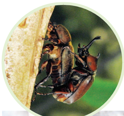
▲夏天的山林間可以看到交配的獨角仙。