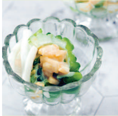
▲口感爽脆的青苦瓜很適合做涼拌菜，酸甜的鳳梨優格醬汁能覆蓋苦味呵！