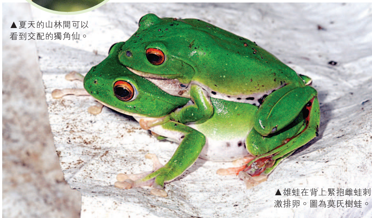
▲雄蛙在背上緊抱雌蛙刺激排卵。圖為莫氏樹蛙。