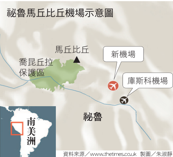
製圖／朱淑靜