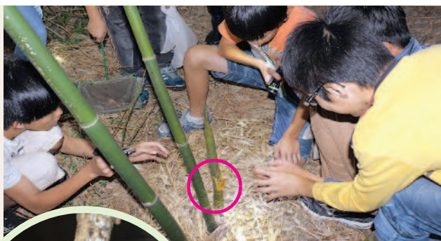
▲學生參加移除外來種斑腿樹蛙活動。

。待雌蛙選好對象後，雄蛙就緊緊抱接在雌蛙背部刺刺激雌蛙排卵，自己再緊接著排出精子，完成受精過程。