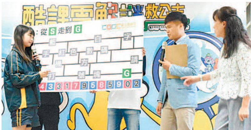
▲臺北市教育局舉辦酷課雲解謎活動，邀請學生（左一）上台解謎。

桃園市、屏東縣地區國中昨天舉行畢業典禮，各校都為畢業生播放回顧影片，不少人感動落淚。其中桃園市青溪國中最特別，在校生成答詞用「演」的，畢業生致