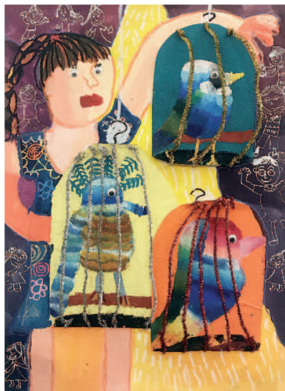
籠中鳥 蕭瑄瑤 · 苗栗縣建國國小三年四班