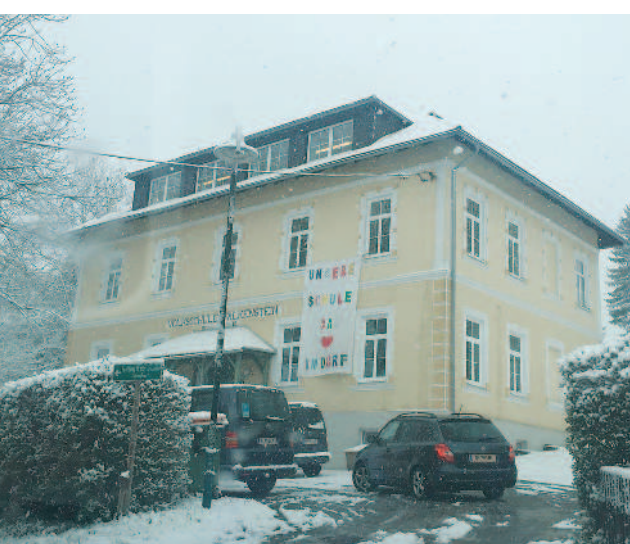
▲筆者參訪位於奧地利法爾肯施泰因的山區小學，學校本身僅有一棟三層樓高的簡單建築。

訪談中，校長和教師都認同混齡教學是保留鄉村小校的有效策略，同時也是適合在地教育的教學法，多數教師與家長抱持正面態度，學生也喜歡和不同年齡的同伴一起學習，讓學生有更多樣的表現機會。