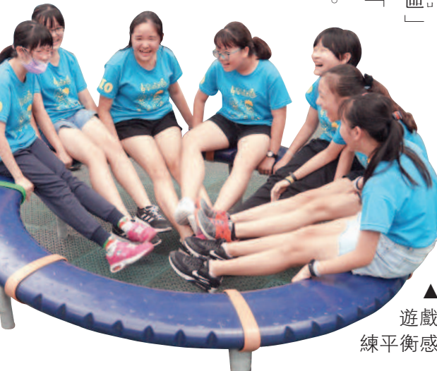
▲共同體驗遊戲器材，訓練平衡感。

供應戰鬥機用油的故事；聽眾們則在腦海中構築戰場場景，一邊聆聽，一邊做心智圖筆記。 接著來到「清水鬼洞」。經過整修，雖然光線較足，但密閉狹長、牆面堆疊鵝卵石的戰備坑道，仍令人毛骨悚然。走一遭後，學生對崗哨、寢室、廁所、狙擊區的印象深刻，都能精準回應導覽員的提問。為了讓大家更認識家鄉，導覽員使出渾身解數的介紹「清水區」、「拍瀑拉族」和「牛罵頭遺址文化」。 午餐時間，學生們享用好不容易訂到的在地美食——鹹香有料的米糕和肉羹湯，口腹也飽嘗了清水的好滋味。 鯊峰山運動公園的競合體驗遊戲場