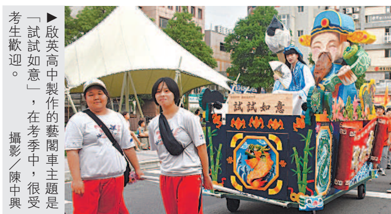
啟英高中製作的藝閣車主題是「試試如意」，在考季中，很受考生歡迎。