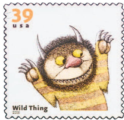
▲跟隨桑達克筆下的主角，讀者就能進入充滿驚奇的國度。圖為美國郵票。

桑達克在成長過程中焦慮、不安、恐懼、憤怒、挫折、忌妒等複雜情緒。他認為：「小朋友需要透過幻想故事來宣洩情感，這是讓他們馴服『野獸』的最佳方式。」桑達克探索孩子真實的內心世界，將負面情緒加以掌控、釋懷，轉化為溫馨的故事，令小朋友格外有共鳴。