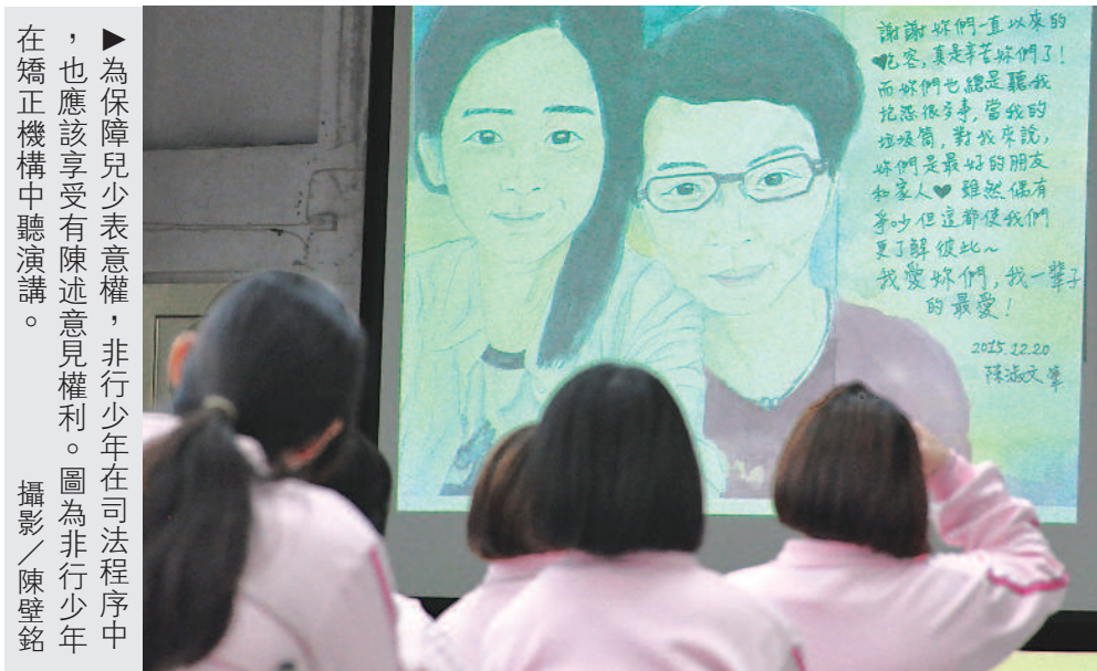
為保障兒少表意權，非行少年在司法程序中，也應該享有陳述意見權利。圖為非行少年在矯正機構中聽演講。

九個月才申訴」為由，認為該少年只是在借題發揮，「機構的兒少，究竟知不知道有申訴管道可以表達意見？想表達卻說不出來的又有多少？」