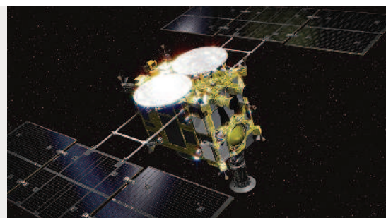
▶日本的小行星探測船「隼鳥二號」有自動分析岩石礦物的儀器。

「雙折射現象」只有特定的礦物結晶構造才會產生，除了可以透過光線折射發現，有些也能直接由外觀辨認。