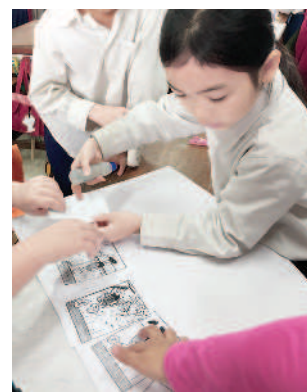
▲重新排列小亨利漫畫順序，創作新故事。