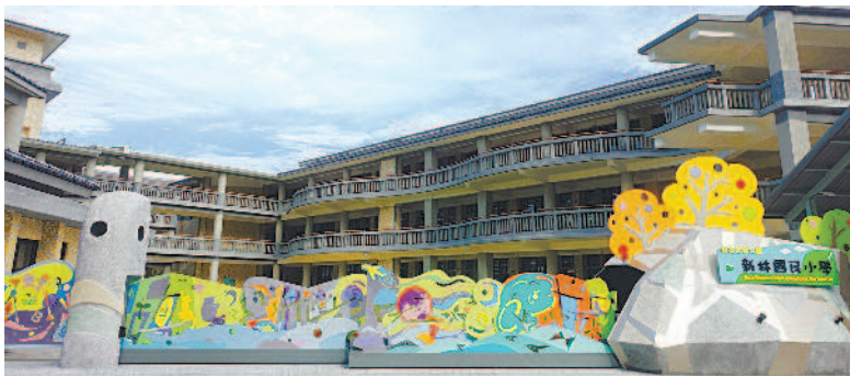
▲新北市新林國小各棟校舍以迴廊連接，學生不受天氣影響，可以在校園自由穿梭。 ▲新竹市關埔國小每個教室的空間不同，教師的教學創意就從安排學生坐位開始。

九二一大地震將屆滿二十年，當年教育部推動「新校園運動」，重建校園充滿特色，但因興建時間倉促，校舍功能仍有不足之處。如今學校還面臨少子化問題，未來規畫校舍建築時，除了考慮地質、結構及安全外，如何顧及環保、自然生態等因素，並結合教育理念和社區形態，以符合師生需求，達到永續使用，讓校舍發揮更大用途，也值得深思。