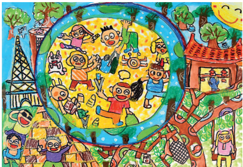
和世界一起做環保 王鈺茜 · 嘉義市嘉大附小四年三班