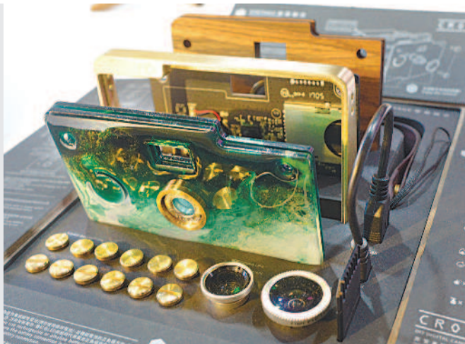
►臺灣文博會的亮點參展品亮相，圖為紙可拍「故宮翠玉白菜」紙相機。

文博會串聯舊鐵道 探索城市軌跡 楊惠芳／臺北報導 二〇一九臺灣文博會將在二十四日到五月五日登場，今年主題為「Culture On the Move——文化行動」，強調文化的動態與多樣性。今年臺灣文博會突破以往，擴大為臺北舊鐵道線串聯五大展區，找回民眾對城市發展的記憶。 文化部昨天在華山文創園區舉辦前記者會，文博會大使藝人黃子佼透過播放臺北機廠內部景觀，搶先帶大家一睹百年鐵道線的歷史軌跡。 其中在華山文化概念展區，「演變舞臺」將打破前臺、後臺界線，讓展場即是表演場，共有四十多場表演，動員二十九個團體跨界演出，例如布袋戲大師陳錫煌將與新生代搖滾樂團「拍謝少年」合作，打造野臺大戲。 空總的「文化大學」以「混水釣蝦場」為題，舉辦展覽、論壇與工作坊等；工藝館則以「茶3.1415」為題，論述茶文化演變的時空路徑。 另外，位在臺北機廠「NEXT鐵道博物館」，則打開局部圍牆，讓民眾一覽臺北機廠全景，看見過往時空軌跡。