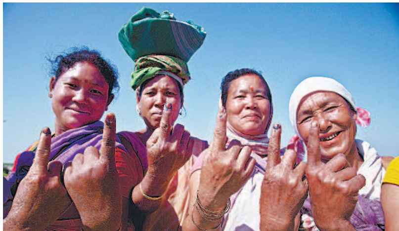
▲印度幅員遼闊、地形複雜，選務人員必須跋山涉水到各地設投票站（上圖）。印度政府透過各種措施，鼓勵女性投票，使女性投票率越來越高（下圖）。

鼓勵女性參與 設專用投票所 印度自一九四七年獨立後，便賦予女性投票權。在過去的國會大選中，有越來越多的女性參與投票。根據統計，二〇一四年的國會大選，有一半省份的女性投票率超過男性，當時女性投票率創下空前的百分之六十五點六三。 但根據專家的調查和比對，目前仍有超過兩千萬印度女性是幽靈人口，無法投票。對此，印度選委會已制定多項措施，希望建立完整的女性投票人名單，確保沒有女性成為幽靈人口，並與各村落的兒童福利工作人員和婦女團體合作，透過媒體鼓勵女性登記投票。 在這次大選中，印度選舉委員會也規畫了女性專用投票所，每個投票所都會安排一名女性警察值勤，讓女性能安心投票。