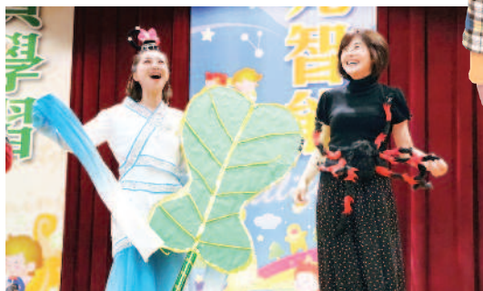
▲鐵扇公主和蜘蛛精在臺上笑開懷。

圖書館積極配合科技發展，除了帶領學生運用臺北市的線上資料庫學習，也推動市府設計的學習平臺「閱讀e酷幣」，學校中高年級學生都有一組帳號，這樣一來，隨時隨地都能用行動裝置寫作。例如，去野外露營時就可以採語音輸入法，寫出一篇篇感想，而將每週小日記