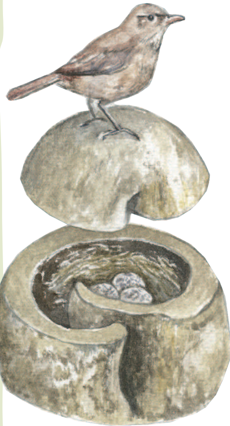
▲棕灶鳥的巢像窯爐一樣，有孵蛋作用。

每當夏季來臨，就是棕灶鳥戀愛的季節。為了迎接即將出生的寶寶，棕灶鳥會用泥巴在樹幹、牆頭或電線杆等堅硬基座上築巢，巢的外