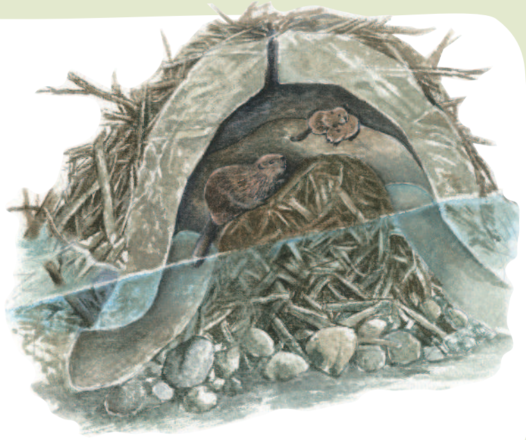
▲河狸幫自己的巢蓋護城河，避免敵人入侵。

沒有大張旗鼓的剪綵畫面，不過在小怪獸世界中，可是天天都動工，大興土木！ 文／曾柏諺