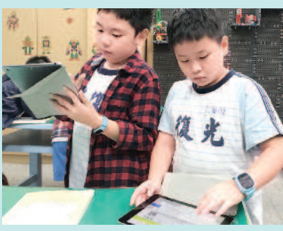
▶學生認真的用平板電腦為繪本錄音、寫閱讀心得。

近年來，「閱讀力等於競爭力」的風潮日盛，如何帶領學生閱讀，成為教育單位很重要的課題。光復國小教師設計各種活動，吸引學生到圖書館「布克斯王國」駐足。