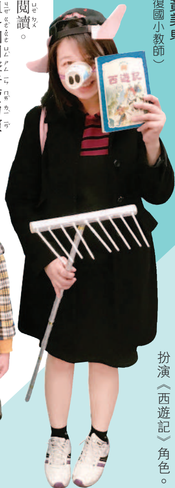
▶家長和學生在圖書館扮演《西遊記》角色。

前陣子的書展主題是《西遊記》，郭老師除了把圖書館布置成花果山水濺洞，也商請校長和主任特別演出，前幾分鐘還在臺