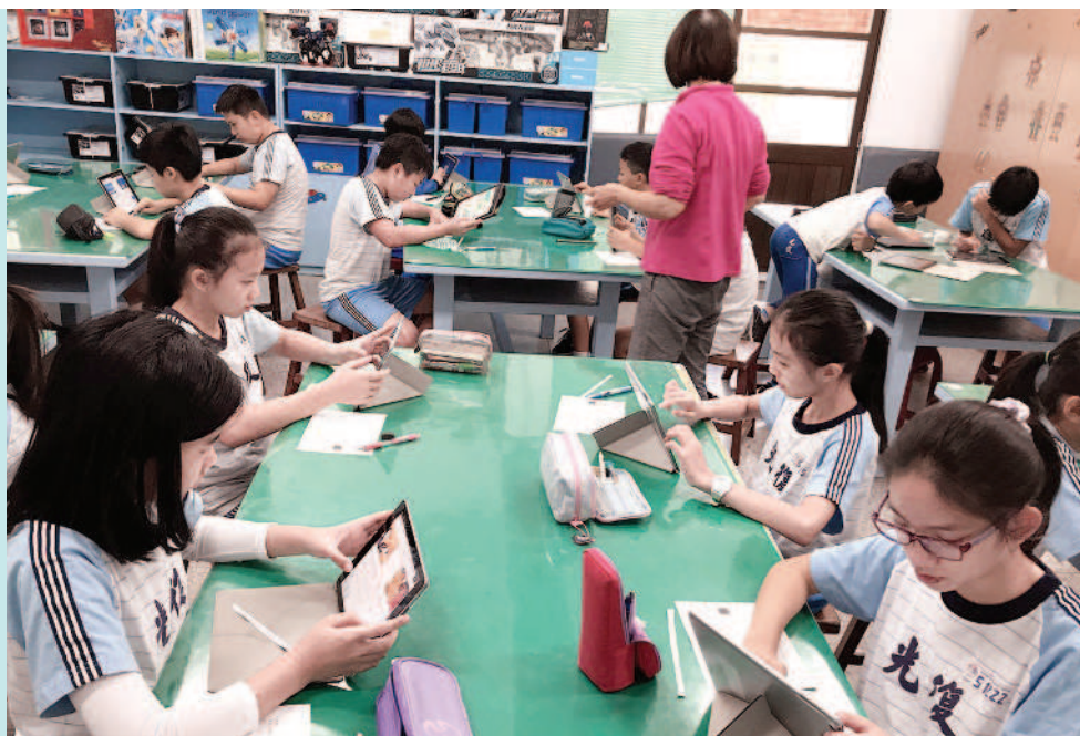
▶用平板電腦搜尋線上資料庫的電子書。