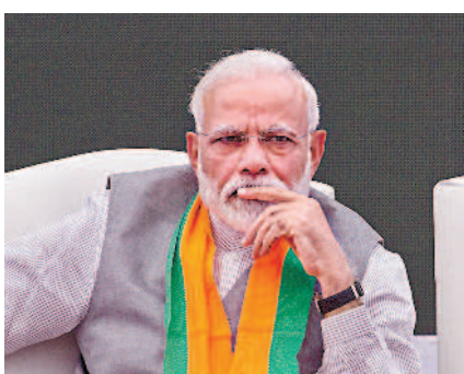
▲印度總理莫迪領導的印度人民黨在選前被看好，可能取得執政權。

印度國會分為上、下議院，下議院議員共五百四十五席，其中五百四十三席由人民黨五年改選一次，兩席由印度總統任命。但印度總統僅有象徵地位，實際權力掌握在總理手中。 任何政黨如果取得下議院過半的兩百七十三席，其黨魁就成為總理，如果沒有政黨取得過半席次，取得多數席次的政黨也能聯合其他小黨，組成聯合內閣執政。 上議院議員共兩百四十五席，任期六年，每兩年改選三分之一，十二席由總統任命，其餘則由選舉產生。 上議院在各種立法方面的權力與下議院相同，但下議院在財政預算方面擁有優先權。如果發生立法衝突，兩院可聯合開會，但因下議院人數較多，較占優勢。