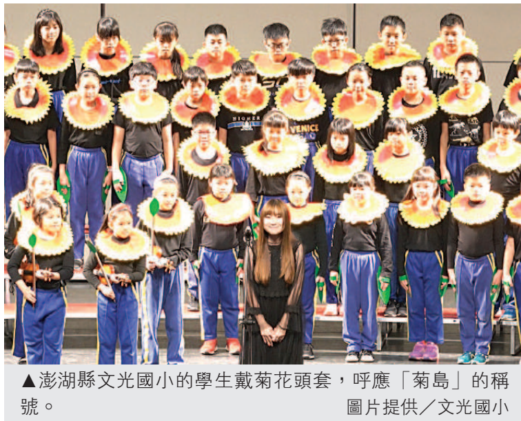
▲澎湖縣文光國小的學生戴菊花頭套，呼應「菊島」的稱號。

臺中市教育局日前舉辦校園創意節能競賽，國中組由沙鹿國中榮獲第一名，得獎影片呈現學生改造校園能源環境，例如教室智慧灌溉植栽系統