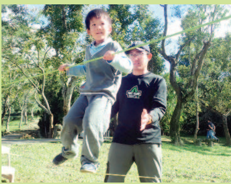
▶幼兒園學生進行走繩運動。