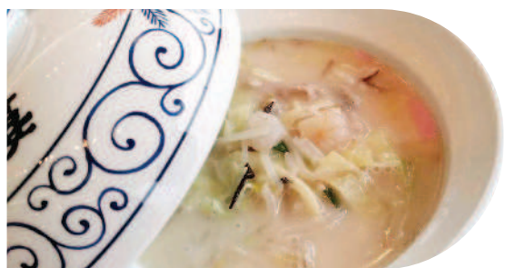
▲長崎四海樓的「強棒麵」。