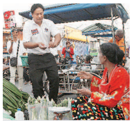
▲為泰黨候選人改名塔信，拉近和選民的距離。

在今年泰國的國會大選中，「為泰黨」有十名候選人的名字與長期流亡海外的前總理塔信一模一樣；另外也有五名女候選人名字，與同樣流亡海外的前總理盈拉相同，盈拉是塔信的妹妹。塔信早在二〇〇六年就因為軍事政變被迫流亡海外，但泰國民眾對他的愛戴卻沒有減少。正是因為民眾對於塔信兄妹的感情，今年許多候選人會紛紛改名，希望能透過與前總理一樣的名字，得到民眾的關注與共鳴，提升知名度。