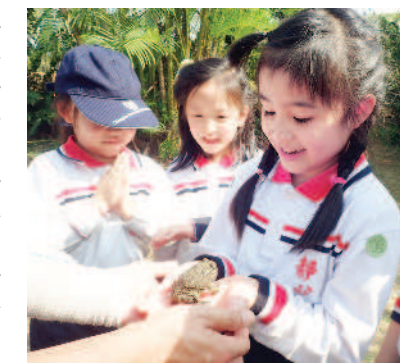
▲與大自然近距離接觸。

根據英國牛津大學的研究，現實中將近一半的工作會在未來二十年消失，而這個世代的孩子未來將從事的工作有百分之六十五還未出現，因此，只學習課本上的知識是不足以解決問題的。靜心高中建構了從 幼兒園到高中的探索體驗課程，讓學生透過豐富又富有挑戰性的課程，培養迎接未來的「軟實力」。