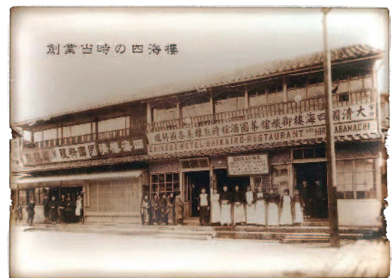
▲創業初期的四海樓(攝於四海樓強棒麵博物館)。