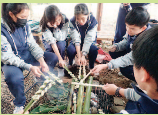
▶中學部學生將麵團纏繞在棍子上烤「蛇麵」。