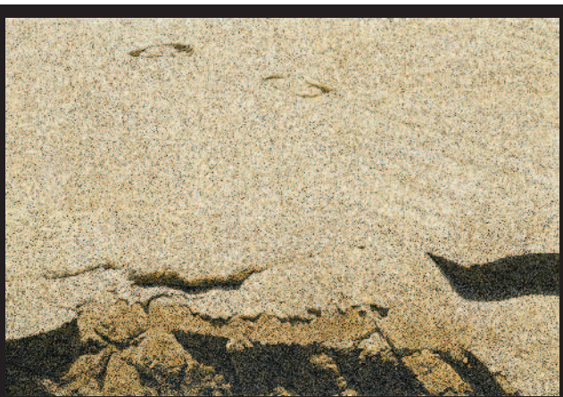
▲周珠旺〈點沙1〉 ▲李梅樹〈假日閒情〉 ▼梁晉嘉〈玉荷包〉 ▶許坤成〈箭傷的石膏像〉