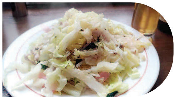
▲長崎的「盤子麵」(攝自浦上寶來軒別館)。