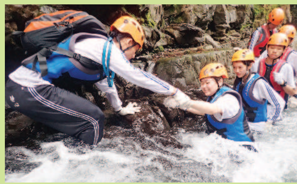
▶中學部學生挑戰溯溪。

金魚缸裡養不出鯨魚，靜心高中鼓勵並陪伴學生勇敢的面對挑戰，期盼他們把世界當教室，而不是把教室當世界！