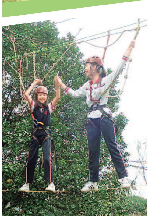
▲小學部學生在蔓藤路相互協助。