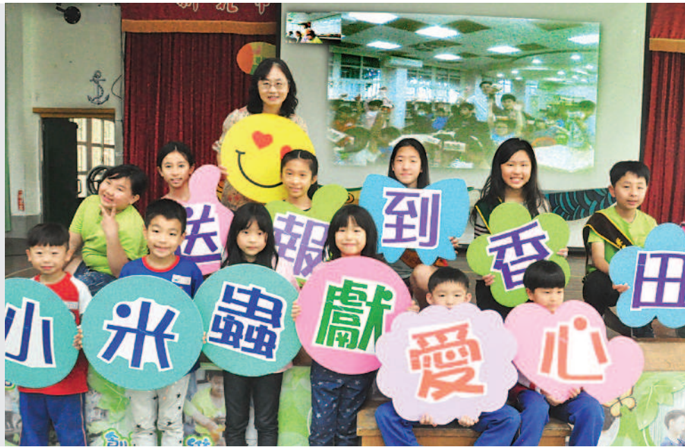
►新北市米倉國小「小米蟲獻愛心」，贈報給彰化縣香田國小。

像是不隨手關燈，洗完手未關緊水龍頭等，因此，在教室設計智慧灌溉植栽系統、溫溼度感測裝置，學生觀察室內溫度變化，並設計節能、散熱的創意作品，改善環境。