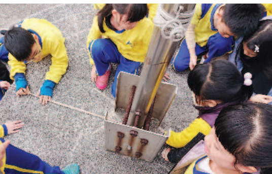
▲用數學的方法測量升旗臺是不是半圓形。

本整齊的放在一格一格的書櫃裡，如果知道一格裡頭有幾本書，再乘以書櫃數量，不就可以簡單算出全部有多少本書了嗎？這是學習題中常出現的理想情境，然而現實狀況可沒那麼簡單！