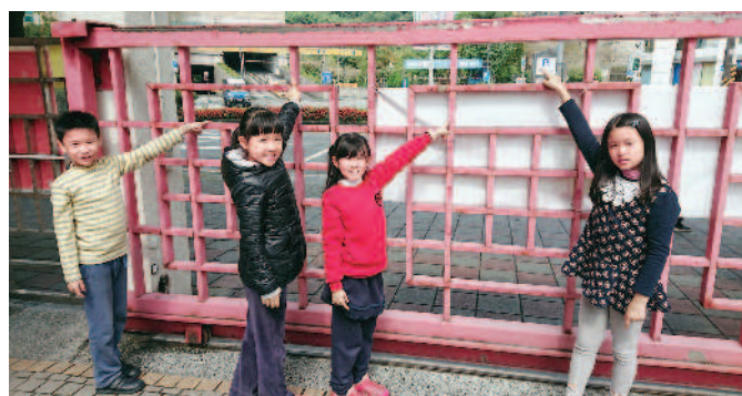
▲算算看校門上有幾個長方形。