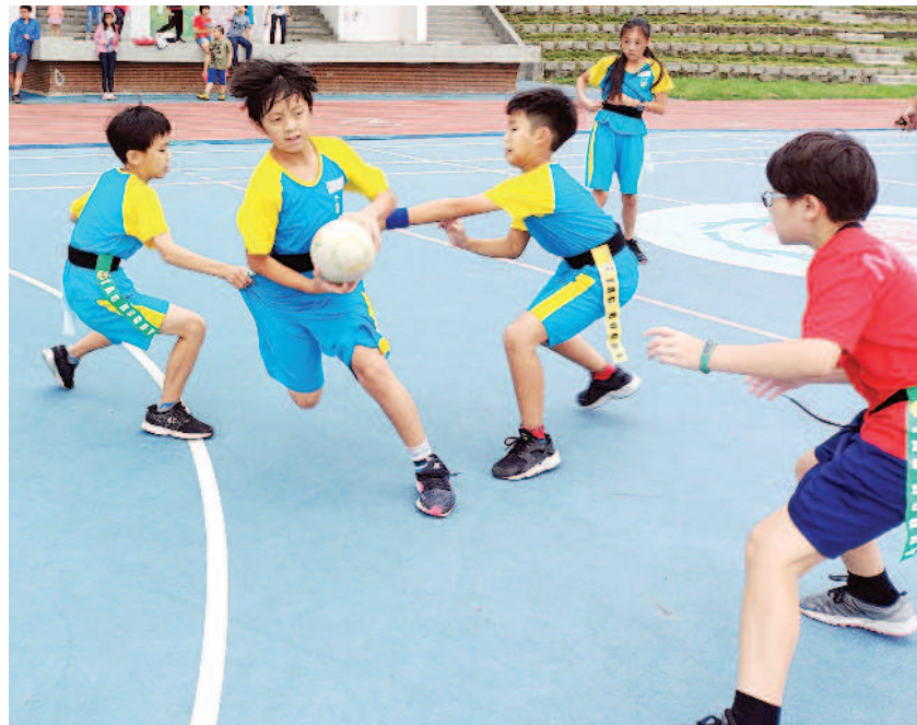
▲跑得快、做假動作、閃躲技巧佳，都是得分條件。

趣。全臺不少中小學都組成校隊或社團推廣這個 激烈的身體碰撞，屬於老少咸宜的運動；而且男生女生都能參加，只要熟悉如何傳、接球，以及簡單的規則，就能享受達陣的成就感與樂趣。