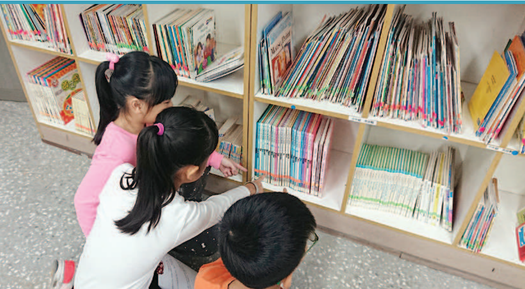
▲►用書格來估算圖書館書本的數量。