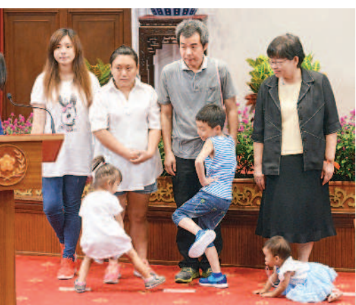
總統府百年特展開展 總統府建築百年特展今天開展，副總統陳建仁參觀特展並頒獎予「100/100總統府不一樣攝影創作比賽」獲獎者，本報攝影記者高修民去年拍攝總統蔡英文簽署兒少未來教育與發展帳戶條例活動，有幼兒在地上自在爬行的照片，獲得專業組優選（如圖）。 報導／吳啟綜

沈育如／臺北報導 臺灣大學校長管中閔上任後昨天首次主持校務會議，解釋參加校長遴選與當選後包括獨董、到中國大陸兼職、為週刊寫專欄等爭議，管中閔表示，希望他是遭遇這些爭議的最後一人。