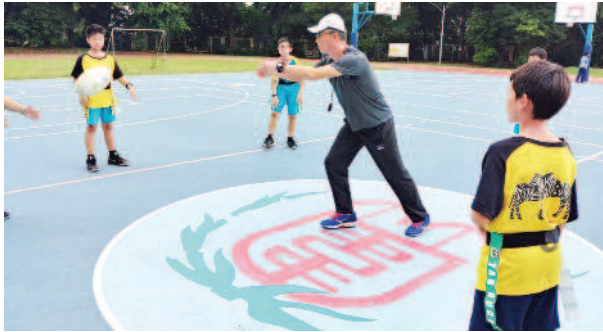
▲指導老師示範正確持球與傳球技巧。

側都掛著帶子，進攻方隊員持球努力 每場十分鐘。 所有隊員腰間兩側都掛著帶子，進攻方隊員持球努力