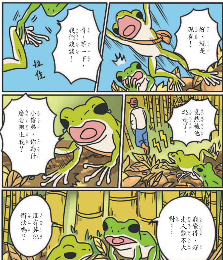
◎哥哥對老爺的建議無動於衷，老爺該怎麼辦？千萬不要錯過下週六〈諸羅遊子V4-3〉！