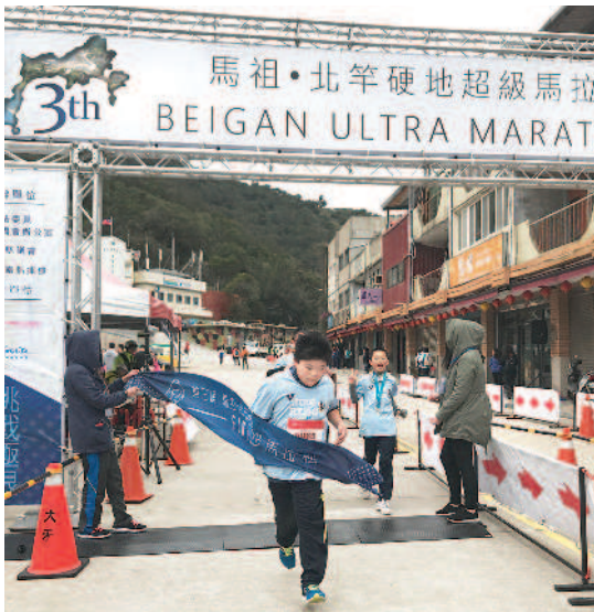
▲連江縣敬恆國中小正值校慶，昨天全校學生一起參加超級馬拉松。

阮筱琪／連江報導 邁入第三屆的二〇一九馬祖北竿硬地超級馬拉松昨天開跑；由於北竿地形陡峻多變，被不少跑友稱為「最硬賽道」。今年連江縣政府在現場布置許多軍事意象情境，打造有戰地特色的賽事，也新增自塘岐村到尼姑山的路線，吸引近千人報名；西莒村敬恆國中小正好校慶，全校學生一起參賽。