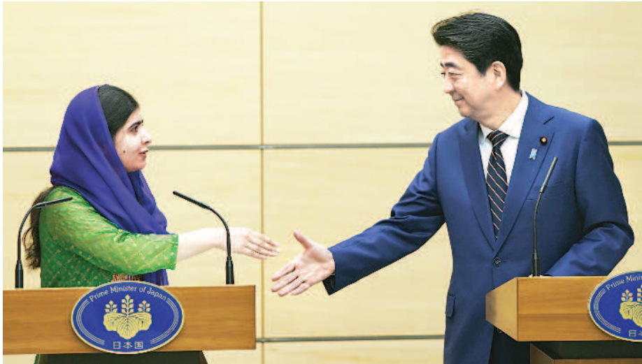
馬拉拉訪日 籲投資女性教育

二〇一四年諾貝爾和平獎得主馬拉拉（左）三月二十二日首度造訪日本，她與首相安倍晉三（右）會談時強調，全球對女性教育的投資不足，希望日本發揮影響力，推動女性教育。安倍回應，對於開發中國家的女性教育，日本將發揮更大的作用。馬拉拉此行是為了參加昨天在東京舉辦的「國際女性會議WAW！」，並發表專題演說。