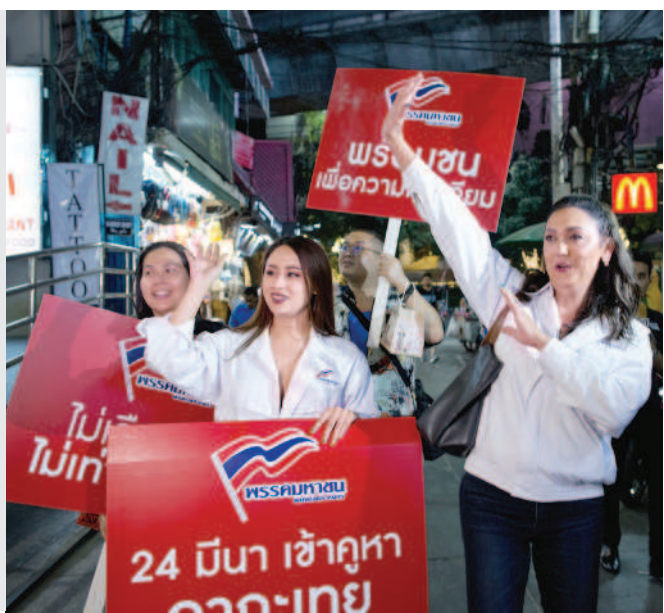
►泰國第一位參選總理的變性者寶琳（右），希望為少數族群爭取權益。

泰國將在三月二十四日舉辦大選，這次共有四十四個政黨推出六十八名總理候選人。其中，代表大眾黨參選的寶琳（Pauline Ngamying）受到不少矚目，因為「她」是泰國第一位變性的總理候選人。寶琳接受手術變成女性以前，早已是泰國足球界的名人，「他」成立國家足球隊後援會，帶領許多族群人士。 在這次國會下議院議員選舉中，共有約八個政黨提名一萬多名候選人。大眾黨也推出約一百六十名候選人，其中有二十人是同性戀者，或是跨性別等少數族群人士。