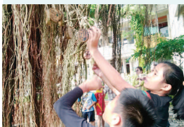
▲寫下祝福小卡，並掛上樹枝。

為了避免病菌蔓延，只能忍痛連根拔除。沒想到前些日子老樹阿公也出現枝葉枯黃的情況，經樹醫師鑑定後，研判是毒蛾和介殼蟲作祟，立即請相關單位協助修剪枯枝並噴藥治療，後續狀況仍須持續觀察。 許願能早日康復，學校舉行老樹祈福活動，希望它能平安度過這次難關。校長首先訴說老樹阿公的生命故事，接著再帶領