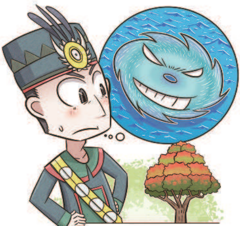
▲魯凱族傳說將颱風與臺灣欒樹連結。