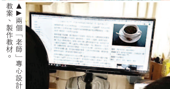
▲兩個「老師」專心設計教案、製作教材。

最近，我引導九歲女兒與五歲的兒子玩「娃娃幼兒園」角色扮演遊戲。孩子們將先前在幼兒園或小學裡的生動活潑表演得淋漓盡致。他們分別扮演幼兒園中不同班級的老師，家裡的幾隻絨毛娃娃就是他們的學生。 在布置好教室之後，他們開始為「學生」準備一系列的課程，因此我提議：「老師上課前要先備課，也就是準備上課的教材與教學方法。你們要不要設計一下上課要用的簡報呢？」想不到孩子們興致勃勃，開始熱烈的討論起課程內容，最後他們決定介紹咖啡的製作方式給學生認識。