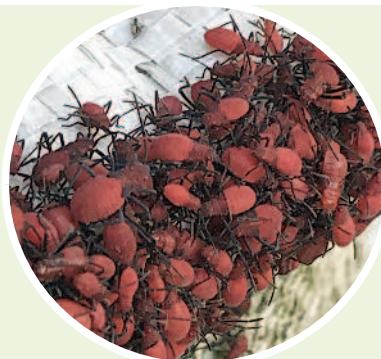
▲紅姬緣椿象。

臺灣欒樹在開花時節，常常引來「紅姬緣椿象」，在樹上吸食樹汁和啃食種子。 紅姬緣椿象的外形和「荔枝椿象」有點像，但牠們對人與作物無害，不僅不用擔心，還可以趁機進行生態觀察呵！