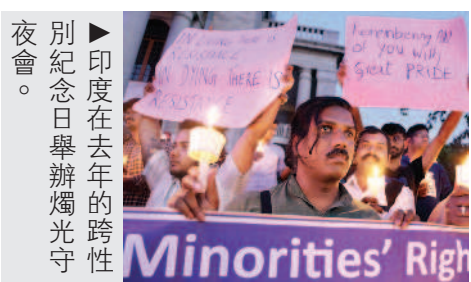
►印度在去年的跨性別紀念日舉辦燭光守夜會。

性別議題在全球越來越受重視，美國媒體CNN整理去年關於增進性別平等的事件，包括女權的進展，以及對跨性別者的尊重。例如沙烏地阿拉伯廢除女性駕車禁令；美國期中選舉後，有一百一十三名女性議員進入國會等。 此外，在當今傳播媒體和流行文化的影響下，性別界線的確顯得越來越模糊。有不少知名時裝品牌推出中性服裝或飾品，讓消費者挑選最符合個人身材和風格的產時，因而激發更多的時尚創意。