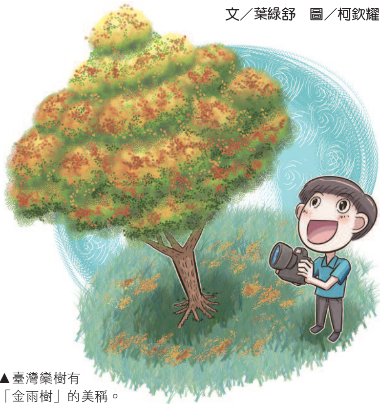
▲臺灣欒樹有「金雨樹」的美稱。