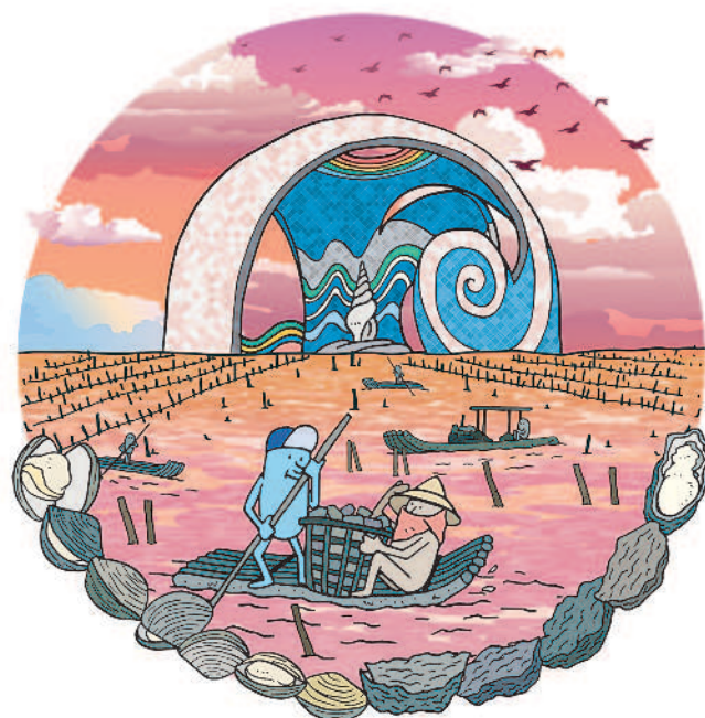
圖 / Marco Chen