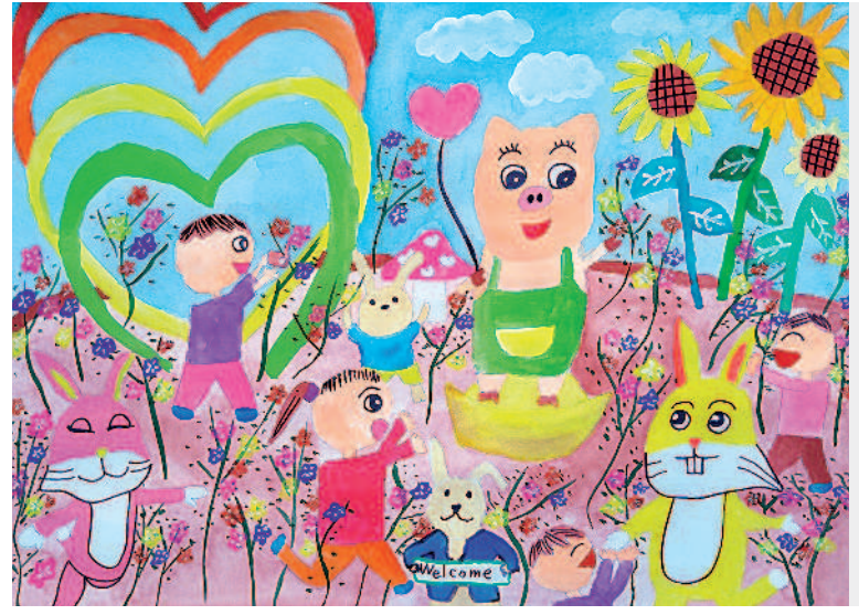
蜀葵花海節 陳亮瑾 · 嘉義市志航國小五年四班