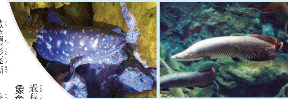
▲腔棘魚可能是生命從水中到陸地的重要環節。 ▲象魚是當代體形最大的淡水魚類。

縮小，但外貌仍與遠古祖先相差無幾，追蹤獵殺的能力也沒有隨身材縮小而稍減，仍然是當今海洋中高效率的獵殺機器。 腔棘魚 失而復得環節 腔棘魚可說是《侏羅紀公園》恐龍復活的海洋版。出現在至今三億七千萬年到一億五千萬年前，腔棘魚曾被認為已在白堊紀滅絕。但隨著一九三八年首度捕撈到活體，次年更證實有群體存活在科摩洛島，為物種演化研究投下震撼彈。