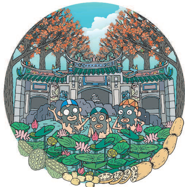
圖 / Marco Chen