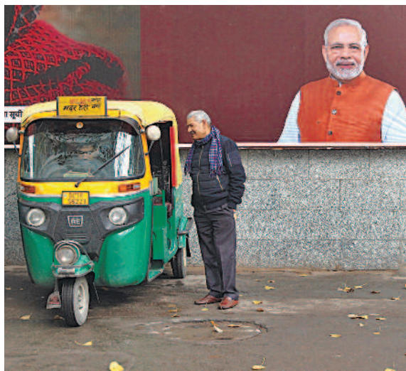
印度民眾為喪生的警員哀悼，並要求當局懲罰施暴者（右圖）。印度今年將舉辦大選，總理莫迪面對強大民意壓力，恐須採取強硬措施（左圖）。