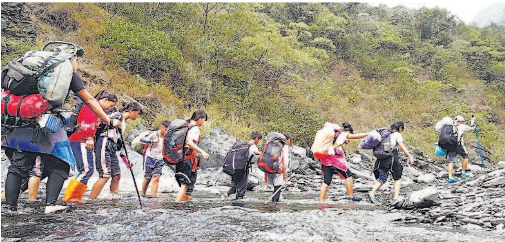
▲屏東縣長榮百合國小師生昨天跋山涉水，前往古大社部落尋根。