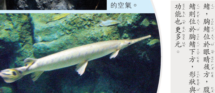
▲火箭魚能夠吸取水面上的空氣。

用魚鰭辨認活化石魚 遠古魚類與現今魚類最大的差異在於魚鰭。原始魚類的胸鰭、腹鰭與臀鰭多在腹部排成一線，大小與形狀並無明顯差異。近代魚類的魚鰭則位於胸鰭下方，形狀與功能也更多元。