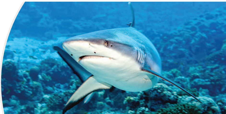
▲遠古的鯊魚仍是當今海洋中的殺手。

生物演化過程中，有新物種出現，有物種滅絕，也有物種躲過大小的災難，至今仍保存祖先樣貌。這些物種的化石標本出現在不同的地質年代，也活生生的存在當今，因此稱為「活化石」。 鯊魚 從古至今的殺手 遠古鯊魚可說是惡名昭彰的殺手，海洋爬蟲類、古鯨和遠古海龜都難逃牠的血盆大口。 電影中出現的巨齒鯊身軀龐大，連現今的大白鯊也要退避三舍。所幸隨著演化，