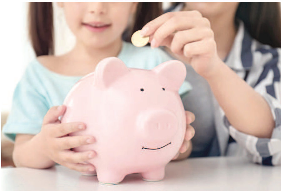
擁有儲蓄好習慣，是學習理財的第一步。