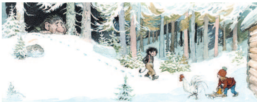
▲ 透過大量的研究和素描，奧圖精準的描繪出幻想和真實完美融合的作品。(圖取自《小巨人提姆的新朋友》)

雪覆蓋的森林慢慢描繪出的動人故事。他把最愛的巨怪 (troll) —— 腦中總有錦囊妙計，集合了幽默、聰明等迷人特質的童話幻想人物，完美融合在真實的森林中。