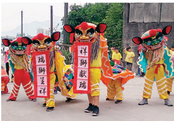
▲參與社區的廟宇活動。

學生的訓練過程從體能開始，接著學習翻獅、洗背、搔癢等專業動作，純熟之後再學習八卦步、七星步、剪步走、黏腳走等步法。鼓鑼組雖然只是在一旁伴奏，但也要抓準節拍和打擊力量，和獅隊合作無間，才能完美的表現出力與美的和諧感。