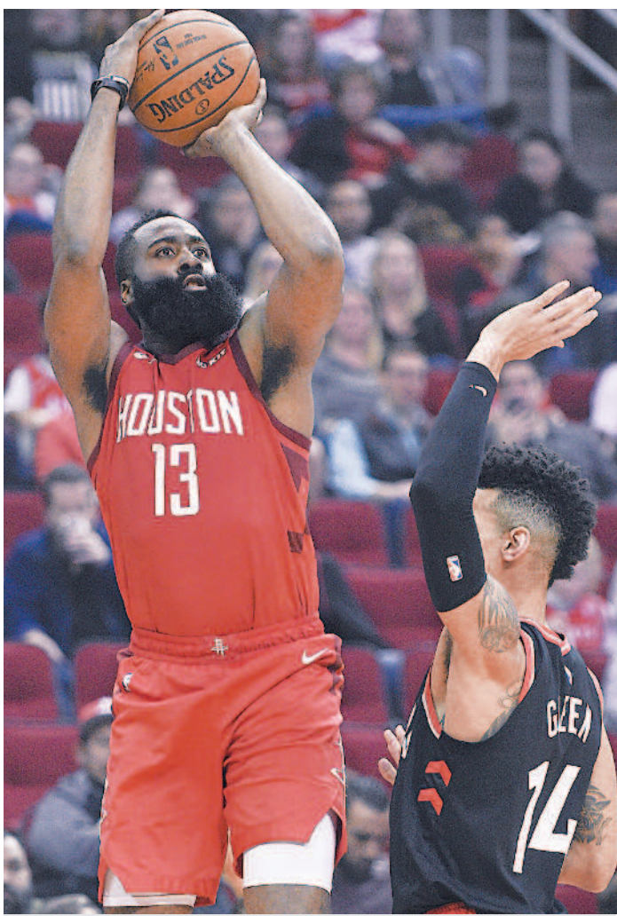
▲哈登（左）的後撤步獨步 NBA。

柯瑞本季初受傷缺賽十一場，截至目前仍投進兩百二十一顆三分球，締造連七季至少投進兩百顆三分球的紀錄，是 NBA 第一人。未來，柯瑞仍可挑戰隊友「浪花弟」湯普森單場十四顆三分球的紀錄，以及傳奇射手艾倫保持的生涯兩千九百七十三顆三分紀錄。柯瑞現在已累積兩千三百四十七顆三分球，排 NBA 第三，第二名是前溜馬隊射手米勒的兩千五百六十顆。