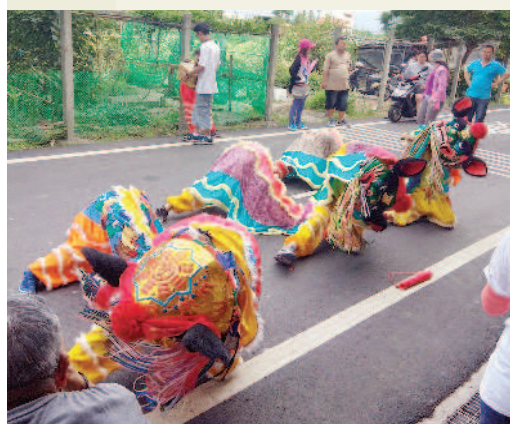
▲對學生的演出，當地民眾也在旁鼓勵。