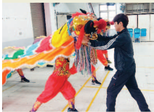
▲教練調整學生舞獅動作。