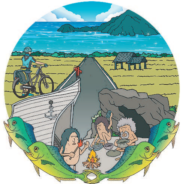
圖 / Marco Chen