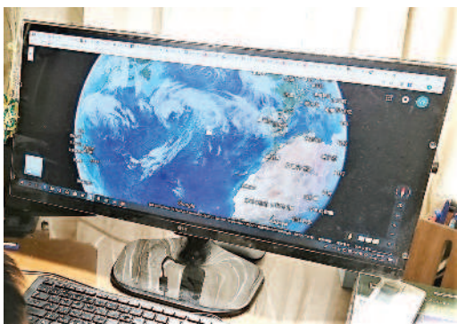
透過查找網路地圖，親子可在家「行遍天下」。

遊戲」。 我教兒子運用簡單的街景功能，讓他扮演一個送貨司機，駕駛「星際卡車」送貨。來吧！這次我們要送貨到澳洲的一個鄉村。」我邊說邊引導他切換街景與衛星畫面，以及操作從衛星畫面中切換到太空模式。 隨後，孩子興奮不已的駕駛這臺可以在路上跑、空中飛、星空中停泊的「星際卡車」到處「送貨」。他很開心的開著太空卡車從宇宙突破大氣層，在空中飛翔鳥瞰，並順利降落到澳洲進行任務。當他切換到太空模式開卡車時，我們討論到為什麼太陽跟地球的不同位置會產生黑夜與白天。當卡車降到大氣層時，他不斷找尋送貨