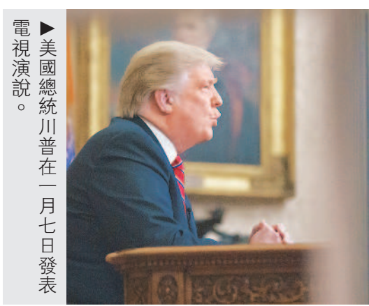
美國總統川普在一月七日發表電視演說。

各國領袖都會針對重大政策或事件發表全國演說，向民眾解釋政府的立場和作為。例如，美國總統會利用「黃金時間」發表全國演說，往往吸引上千萬人口收視。黃金時間指的是美國東部晚間八點到十點一點的電視收視高峰時段，是全美觀眾人口最集中、各大電視網的兵家必爭之地，白宮也將其視為與全美民眾直接對話、籠絡民心的手段。