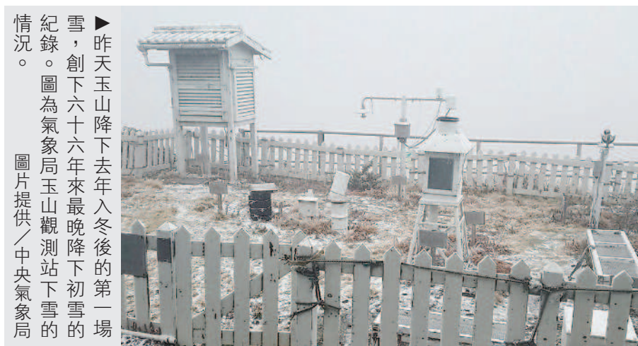
►昨天玉山降下去年入冬後的第一場雪，創下六十六年來最晚降下初雪的紀錄。圖為氣象局玉山觀測站下雪的情況。

除了玉山下雪外，雪山圈谷和合歡山昨天也降下初雪，雪山積雪厚度約十公分，這次也創下雪山圈谷近十年來最晚降下初雪的紀錄。合歡山則是在