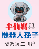
半仙媽與 機器人孫子 隔週週二刊出