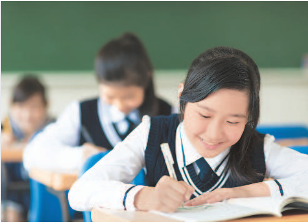
大學學測將至，考生寫作時應把握幾項原則，並注意時間分配。

然而，不管是知性或感性的題型，都要以「精準扼要、提綱挈領、言之有物、發人深省」為寫作的目標，如果能有意識的朝這個方向多加磨鍊，必然能在眾多試卷中脫穎而出，獲得亮眼的成績。