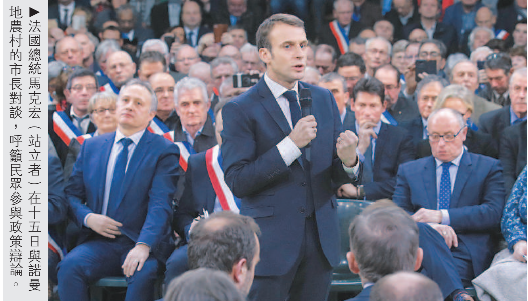
法國總統馬克宏（站立者）在十五日與諾曼地農村的市長對談，呼籲民眾參與政策辯論。

儘管政府做出讓步，民怨卻未平息。一月十二日時，法國仍有八萬四千人上街抗議，比前一週的五萬人明顯增加。民眾的訴求已轉為要求馬克宏下臺，讓全體法國人參與制定更民主的憲法，縮小社會貧富差距，賦稅公平等。