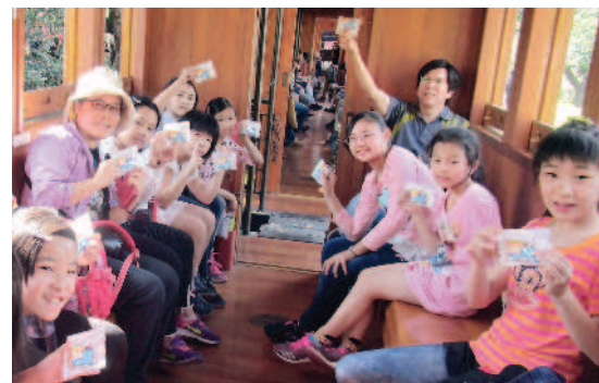
▲在檜木車廂品嚐火車造型餅乾。

搭乘蒸汽小火車 一路檜木飄香氣 阿里山林業鐵路的蒸汽 火車頭平常停駐在車庫， 不出門載客。不過因為適