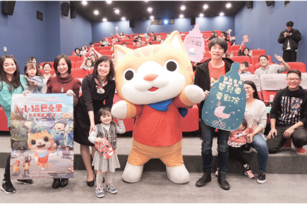
▲府中15「嬰兒車電影院」針對寶實們打造友善的環境，讓父母安心帶著小寶貝享受看電影的樂趣。