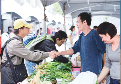
▲臺灣第一個讓農業生產與野生動物共存共榮的「田裡有腳印市集」，每週六在國立臺灣博物館南門園區開市。