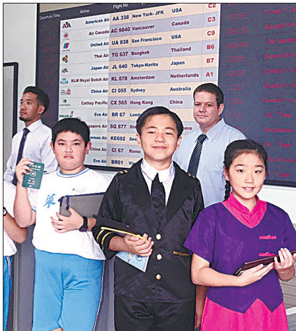
▲蓬萊國小英語情境中心模擬登機，學生化身空服員和乘客，用英語交談。

為了讓學童在生活中，中輕鬆學習英語，愈來愈多國小設置英語學習情境中心，結果發現學習效果顯著。 臺北市英語學習情境中心融入虛擬實境和擴增實境升級2.0版，昨天在臺北市蓬萊國小舉行成果發表會。 蓬萊國小教務主任潘婉茹說，學校有英語情境中心後，近十年來學生學力測驗的英語成績有顯著進步。 臺北市教育局表示，目前全市十二個行政區各有一所學校設置英語學習情境中心，昨天萬福、蓬萊、老松國小三校宣布融入AR、VR，升級為2.0，讓學生可在真實情境中，練習說英語；教育局長曾燦金說，未來十二個英語學習情境中心都會逐步升級。 蓬萊國小學生昨天利用「擴增實境」，化身為空服員和搭機乘客，邀請臺北市副市長陳景峻、教育局長曾燦金搭配平板電腦，模擬搭機實境，用說英語的方式辦理登機、點餐。 潘婉茹說，蓬萊國小在大同區，非市中心，也不是每個學生都有機會補習英語，約十年前，學校有百分之六十學生學力測驗英語成績達「基礎」，但去年達「基礎」者已經提升到百分之七十八，「進階」者達百分之二十，「未達基礎」者只有百分之一。