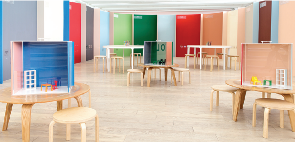
▲北美館「建築的70%」展覽，繽紛的色彩實驗空間，提供親子互動。