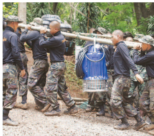
▲泰國士兵昨天忙著運送水泵，希望能抽乾地下洞穴的積水，幫助足球隊員脫困。 文/羅吉希

雖然目前足球隊員全數平安，但現在正是泰國雨季，洞內水位不斷升高，足球隊員也開始學習潛水，以利脫困。 有現實版「鋼鐵人」之稱的特斯拉公司創辦人馬斯克，也向泰國政府表示願意動用科技資源，進行協助，協助兒少脫困。