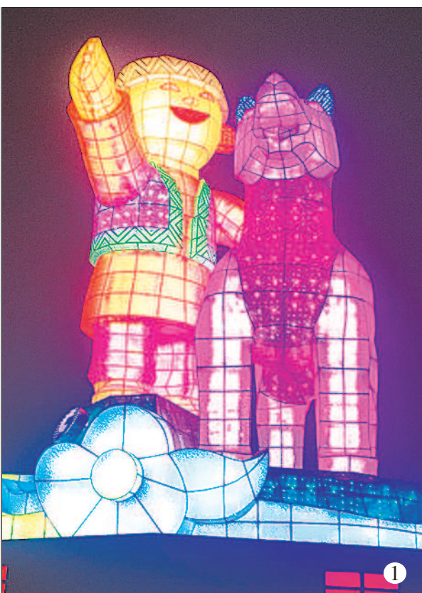
①臺灣燈會主燈「忠義天成」昨晚正式點燈，現場五光十色，美不勝收。②佛光山春節平安燈法會在夜間推出的光雕秀，十分耀眼。③新北市政府昨天舉辦野柳神明淨港文化祭活動，信眾抬神轎衝入海中淨港。