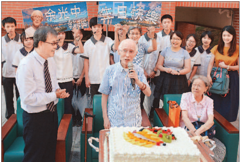
▲余光中（前排中）歡度九十歲生日，中山大學為他舉辦慶祝活動。 ▶余光中生前朗讀他的詩作。