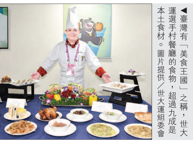
◀臺灣有「美食王國」之稱，世大運選手村餐廳的食物，超過九成是本土食材。圖片提供／世大運組委會

阮筱琪／臺北報導 本屆臺北世大運共有五十國、一百四十一個代表團，總計七千六百三十九名選手、三千七百五十八名隊職員參加，選手村餐廳的「鹽酥雞」，是最受歡迎的臺灣美食，平均每天吃掉一百公斤；第二名是牛肉麵，每天消耗九百碗，等同九十公斤的牛肉麵；第三名則是蔥油餅，一天吃掉五百片；瓜也很受歡迎。 另外，還吃掉六萬個麵包，以及兩萬顆雞蛋。 選手村餐廳主廚說，臺灣鹽酥雞受歡迎的原因，可能是國外的選手喜愛吃炸物，而鹽酥雞比國外雞塊有味道，加上少油少鈉，且以脫油處理，好吃又健康。