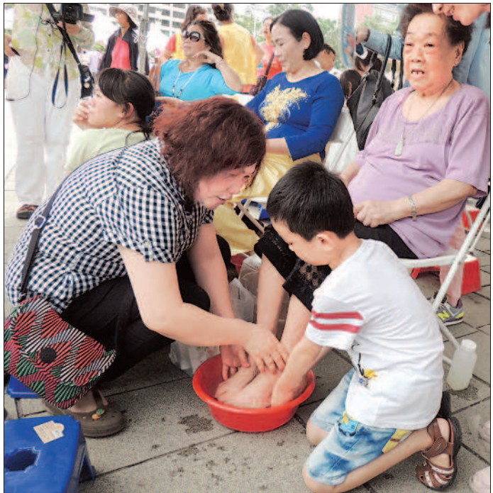
洗腳報親恩 響應母親節暨五一五國際家庭日與兒童安全日，高雄市昨天在文化中心舉辦「孝親·護幼·幸福愛學習」活動，有闖關、園遊會和音樂會，以及「千人洗腳報親恩」儀式，吸引三百多個家庭、近兩千人參加。 報導／攝影／陳景清

臺北市松山高中學生代表希望透過校園平權教育，推廣婚姻平權；桃園市新興高中代表則希望臺灣積極參與國際事務，例如即將舉辦的世界大學運動會，可以吸引外國觀光客，也讓臺灣活躍國際社會。 昨天論壇很多學生關 心教育制度與考試規畫，蔡總統表示，很多學生對教育制度有想法，不過臺灣是行政、立法、司法、考試、監察的五權政府，一個想法轉化成可行政策，非一蹴可幾，要經過制定政策、公聽會、審查法案等多道程序，可能要經過一兩年的漫長過程。 也有高中生擔心參加教育部推動的「青年教育與就業儲蓄帳戶方案」，三年結束後無法順利接軌大學，對此，蔡總統表示，教育部已規畫好方案和配套措施，不用擔心回不去。