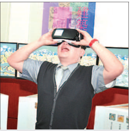
▲臺灣圖書館昨天展出「穿梭三世紀——悠遊臺灣古地圖」成果展，以3D科技展現臺圖鎮館之寶。

喜閱臺灣漂書小站，希望民眾來公園運動休憩時，能利用漂書小站取閱免費圖書，交流好書。根據臺圖統計，舉辦活動四個多月來，已「漂出」超過一千五百本書。