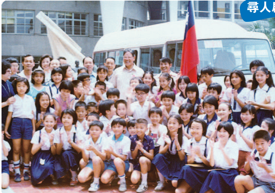
三十五年前，前臺北市長李登輝（後排最高者）與捐獻捐血車的師生合影。

阮筱琪 / 臺北報導 臺灣血液基金會昨天發出尋人啟事，尋找民國七十年七月十五日，在北市光復國小舉行的捐血車「兒童愛心號」捐贈儀式中，一起合照的師生。 臺灣血液基金會表示，民國七十年，無償捐血觀念尚在啟蒙階段，國語日報社當時發起「捐獻小型捐血車運動」，臺北市共有五十五所學校響應。 最後，募款總額共計兩百一十萬兩百八十七元三角，除了可購買原定的「兒童愛心號」外，又加購中型捐血車和小型血液冷藏車各一輛。學生捐獻的捐血車則定名為「兒童愛心號」。 臺灣血液基金會公關杜文靖說，希望「影中人」在十二月中旬前和基金會聯繫；十二月二十三日前將邀請當時擔任臺北市長的前總統李登輝和照片中的師生相聚。