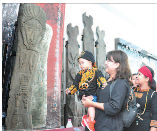
▲昨天望嘉部落的排灣族人，參觀擺放在臺灣大學人類學博物館內的祖先像石雕柱。

沈育如 / 臺北報導 繼去年以結婚方式，「迎娶」被列為國寶的排灣族佳佳屋四面木雕祖靈柱後，臺灣大學人類學博物館昨天再透過「結拜」儀式，與同為國寶的排灣族佳佳屋岸頭目家雙面祖先像石雕柱，結為手足。雙面祖先像石雕柱未來將留在臺大，複製品則迎回部落。 臺大人類學教授胡家瑜表示，雙面祖先像石雕柱約有兩百年歷史，是排灣族Aluvuan社(望嘉舊社)，現今春日鄉歸崇舊社)佳佳屋岸(Tjahuwan)頭