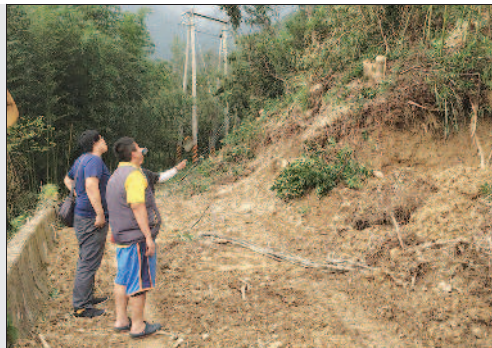
▲桃園市復興區光華國小學區部分路段，土石坍塌嚴重。 ◀臺南市篤加國小操場一片汪洋。

沈育如、陳中興、詹伯望、李榮茂、陳景清 / 連線報導 梅姬颱風雖然遠離，但校園災損消息仍然不斷傳出。根據教育部截至昨天下午三點的統計，這次受災學校共達一千八百二十八所，災損金額超過四億一千多萬元。昨天，全國仍然有超過四十所學校因上學道路中斷、學校淹水、停電等因素停課。對於學生連續三天無法上學，臺南市教育局表示，依據行政院