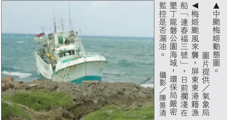
▲中颱梅姬動態圖。 梅姬颱風來襲，屏東東港籍漁船「連春福三號」，日前擱淺在墾丁龍磐公園海域，環保局嚴密監控是否漏油。