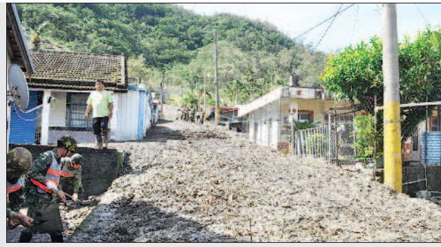
▲臺東縣愛國埔本部落土石崩落到住家與道路。 ▲屏東縣琉球鄉白沙國小校舍嚴重受損，教室多處門窗玻璃破裂。

報導 陳景清、林靈、洪素蓉、楊惠芳／連線 莫蘭蒂颱風重創南臺灣，以及離島金門、小琉球，行政院長林全、屏東縣長潘孟安及臺東縣長黃健庭，昨天分別前往金門縣、屏東縣小琉球及臺東縣大武壠愛國埔本部落勘災。小琉球幾乎全島