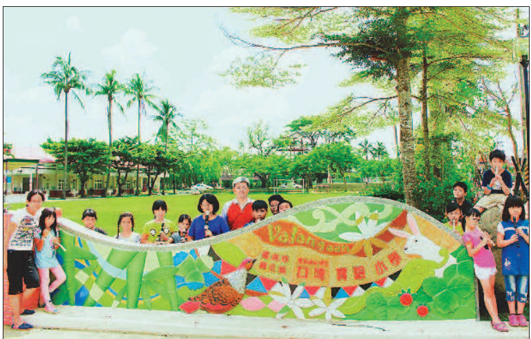
▲臺南市新化口碑國小上週更名為口碑實驗小學，展示校門入口意象，將推動西拉雅文化。

特色與品牌，因此，有家長不惜搬家，讓孩子從北部都會區南下就讀；在少子化浪潮中，該校學生數不減反增，從去年的一百五十一人增加為一百八十四人。華南國小也從幾年前的二十三人增為九十人。