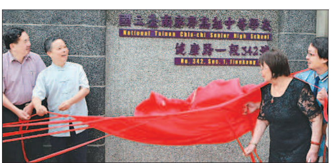
▲家齊高中昨天邀請校友為新校名揭牌。

「家齊女中」校名字樣合影留念，舊校名的字樣已在日前卸下。日本時代校歌〈汐見丘〉所提的「汐見丘」，位在學校東南方約一百公尺，現為臺鹽公司所在地；當年站在小丘頂上，可以遠眺安平潮汐。