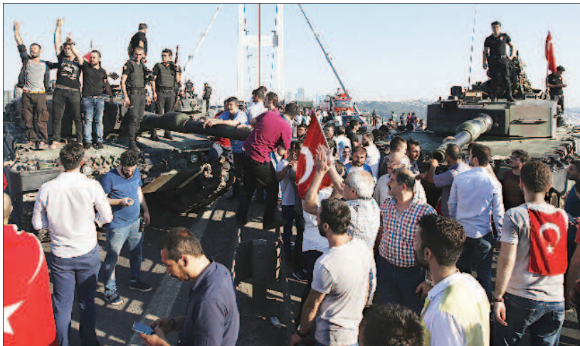
▲昨天上午，在土耳其伊斯坦堡的博斯普魯斯大橋邊，效忠土耳其總統艾爾段的警察，接收被軍隊遺棄的坦克車。

吳啟綜、楊惠芳 / 綜合報導 土耳其昨天驚傳軍事政變，叛軍進駐首都安卡拉，轟炸總統府，攻擊國會大廈，以坦克車封鎖伊斯坦堡連接歐亞的博斯普魯斯大橋，並占領國營電視臺，同時發布聲明表示，不滿總統艾爾段背離土耳其的世俗主義傳統。但是政變不到八個小時就宣告失敗。土耳其總理尤迪倫表示，土耳其政變未遂，造成至少兩百六十五人死亡，另有近三千名叛變官兵遭逮捕。