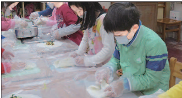
有吃·有玩 ▶昨天是兒童節，各地舉辦慶祝活動。新竹市政府和紙風車劇團，即日起到十日在新竹市市徑場推出「兒童藝術節」，讓兒童快樂過節。報導·攝影/高修民 ▲昨天也是清明節，習俗中，除了掃墓祭祖外，還有吃潤餅。臺北市清江國小學童日前學習自製蔬菜潤餅。報導/阮筱琪 圖片提供/清江國小 相關新聞刊第15版

也能到國外教華語文。已有十多名學生通過華語教學能力認證考試，獲得華語教學資格。 臺北教育大學長期培育國小、特教及幼教師資，該校語文與創作系也培育華語教學師資。華語文中心主任、華語文教學碩士班助理教授