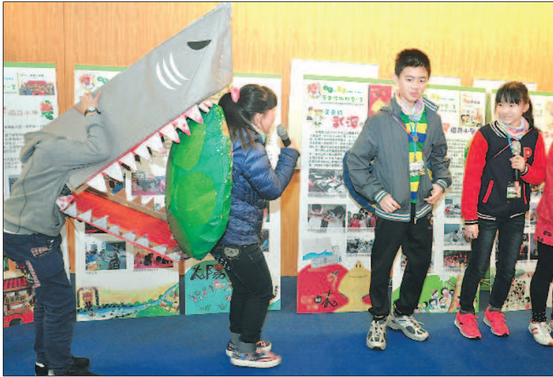
▲學童在臺北國際書展中，演出繪本中的故事。

指出，滑世代不只習慣用滑的，還喜歡用聽的，未來「用聽的方式」接受資訊，是不可避免的趨勢。 臺灣漫讀公司董事長塚本進則認為，臺灣具有豐富的出版能量，但近年紙本出版開始萎縮，各家出版社自行推出的電子書又有格式混雜的問題，他擔心臺灣出版業會逐漸衰弱，希望能加速且整合臺灣電子書的出版，向國際發揚臺灣文化。