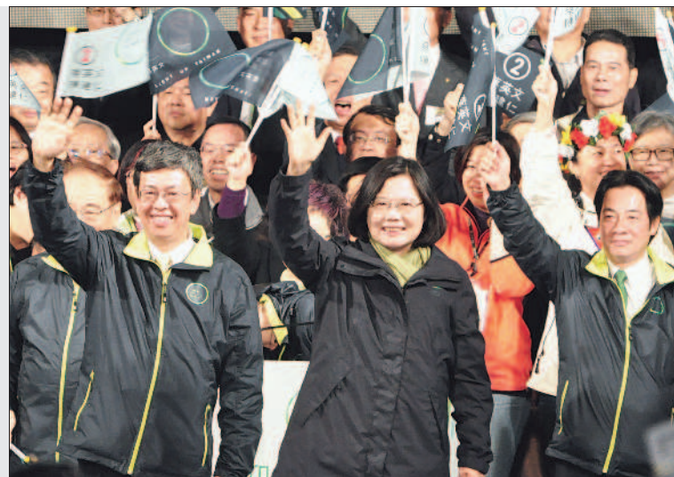
◀▲總統大選民進黨籍候選人蔡英文得票率超過五成六，當選總統（上圖）；民眾揮舞旗幟，慶祝歷史性的一刻（左圖）。