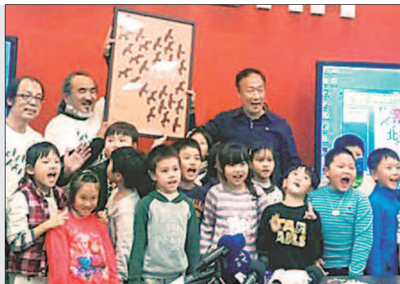
▲▲臺北市大屯國小二年甲班陳冠聿寫信給鴻海董事長郭台銘，請他救救老鷹（左圖）。郭台銘（上圖後排右一）和二年甲班師生相見歡。

「親愛的郭台銘先生……我覺得《老鷹想飛》這部電影很重要，但是很少人看，請您幫《老鷹想飛》打廣告吧！謝謝您！」為了救老鷹，臺北市大屯國小二年甲班學生陳冠聿，寫信請鴻海集團董事長郭台銘幫忙，結果