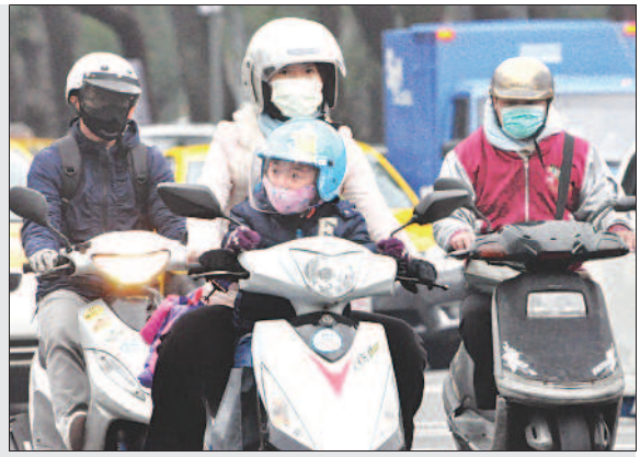
▲昨天，臺北市天空灰濛濛，民眾騎機車載孩子上下學時，紛紛戴口罩，防止吸入太多汙染物。 ◀臺灣地區昨天受中國大陸霧霾影響，細懸浮微粒指標偏高，除東部有中央山脈阻擋外，西半部許多地區都出現「紫爆」。