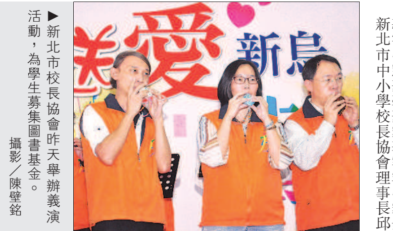
▶ 新北市校長協會昨天舉辦義演活動，為學生募集圖書基金。

楊惠芳 / 新北報導 「有愛就能改變世界」，新北市中小學校長協會與新北市教育局昨天合辦「送愛新烏藝起相挺」大型義演活動，號召校長一起進行「公益」及「熱血」的集體活動，昨天在新店捷運站廣場義演，為烏來學童募集圖書基金。 新北市中小學校長協會理事長邱