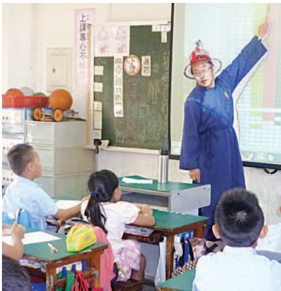
▲迎王達人班頭舅舅介紹迎王平安祭典。