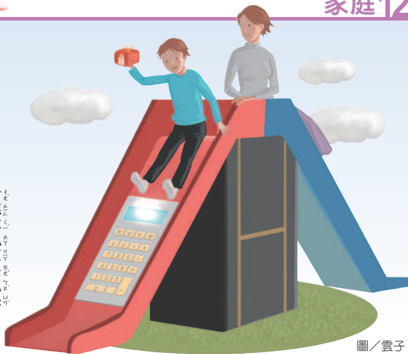
圖 / 雲子

常聽其他家長抱怨，孩子只要看到想要的東西，不管價錢多少，就吵鬧著非買不可，如果家長不買，孩子就發脾氣、哭鬧或摔東西，使得親子關係非常緊張。 聽多了這類故事，我從兒子小時候就耳提面命，交代他在買東西前要多考慮，「只買需要的，不買想要的」，兒子接受這個原則已經成了習慣，所以用錢算得上謹慎。 猶記得兒子在讀小學三年級的時候，有次學校舉辦戶外教學，地點