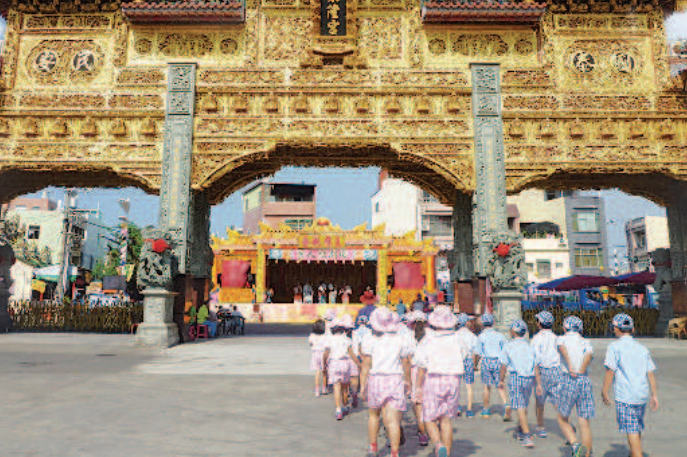
▲學生參觀東隆宮牌樓。

上才會平安。班頭舅舅帶著學生走出校園參與迎王活動，在參觀全國最大艘的「王船」時，特別向學生澄清，東港只有迎王祭典，沒有王船祭。透過實際參與迎王平安祭典，學生了解在地文化，