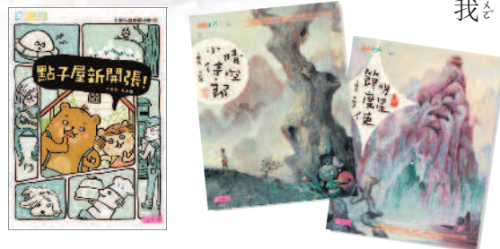
▲哲也想寫的是：讓人家眼睛發亮的，會噗哧笑出來的，看完會覺得心裡很舒服、很滿足，好像有一片藍色天空的書。

每次開始寫一篇新的故事以前，我都曾想：這篇故事是要寫給什麼樣的人看的？他們會想看到什麼樣的故事呢？當然，我是一個童書作家，所以我知道，我的故事是要寫給「小朋友」看的。 我自己也曾經是「小朋友」，大概四十多年前吧，那時候我也是個整天玩得滿頭大汗的傢伙。但是四十年不是一段短時間，所以我已經不大記得當小朋友是什麼感覺了。 這時候，我就會牽著我們家的小狗，走到咖啡店去買一杯咖啡，或是去便利商店買一瓶可樂，順便看看小學生放學，看看小孩子跑回家的樣子，看看他們在陽光下笑得東倒西歪的樣子。對了，我小時候就是那樣啊！