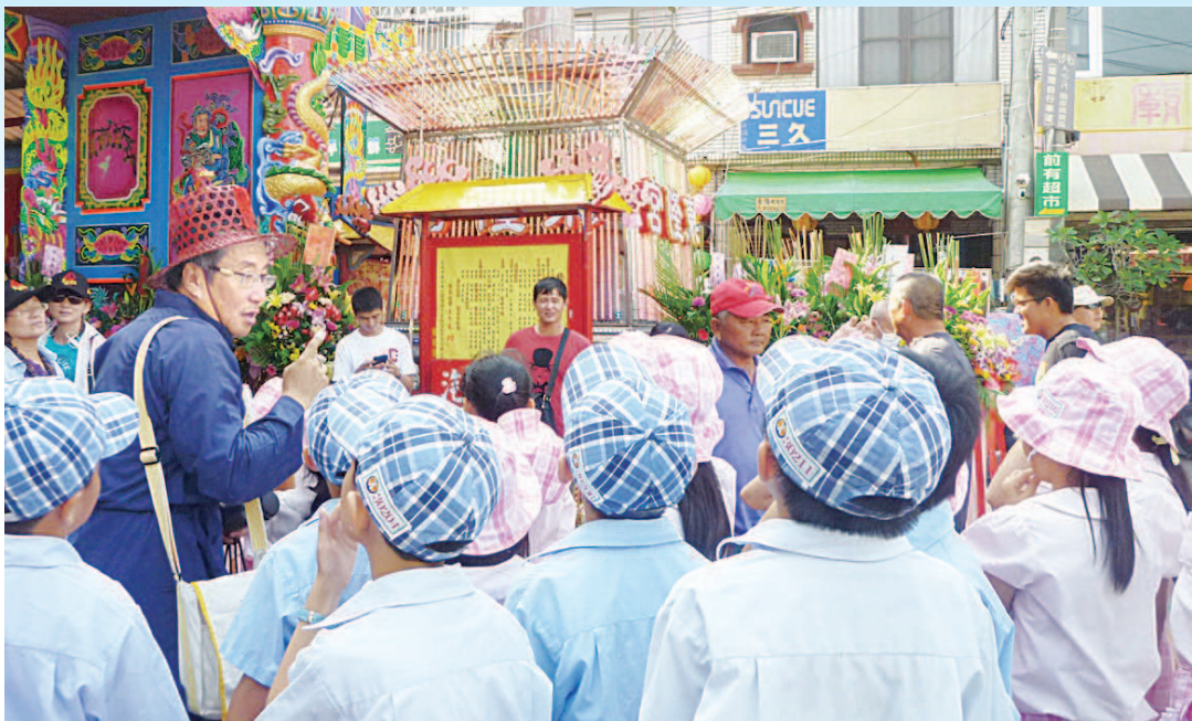
▲班頭舅舅帶領學生參與迎王活動。