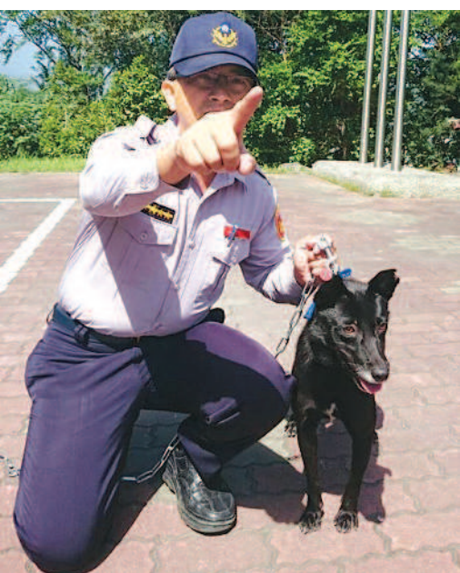
▲新進警戒犬還聽不懂「蹲下」指令，主人只好先示範。

「伊曼」牠們目前正在接受訓練，看到可疑人事要警戒，還要跟著員警協助勤務，在派出所周遭巡守，關山警分局則提供牠們吃住，以慰勞和獎勵牠們認真工作。