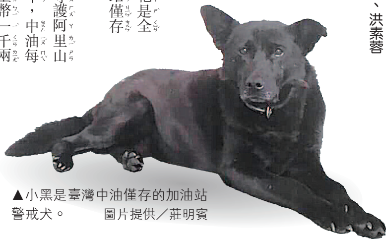
▲小黑是臺灣中油僅存的加油站警戒犬。

莊明賓回憶，第五代警戒犬小黃過世，警戒犬一職出缺。當時還是流浪狗的小黑常在加油站附近遊蕩，最後「越睡越靠近」