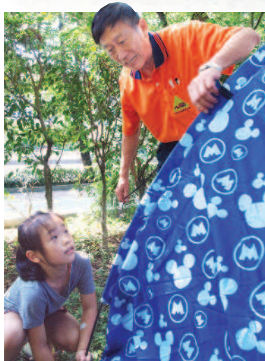
▲教練指導小朋友怎麼搭帳棚。

走出戶外呼吸新鮮空氣，除了學習搭帳棚、野炊外，還可以觀察草叢裡的蟋蟀、樹幹上的獨角仙，感受生態之美。玩樂中，也可以學習如何愛護動植物，保護大自然。