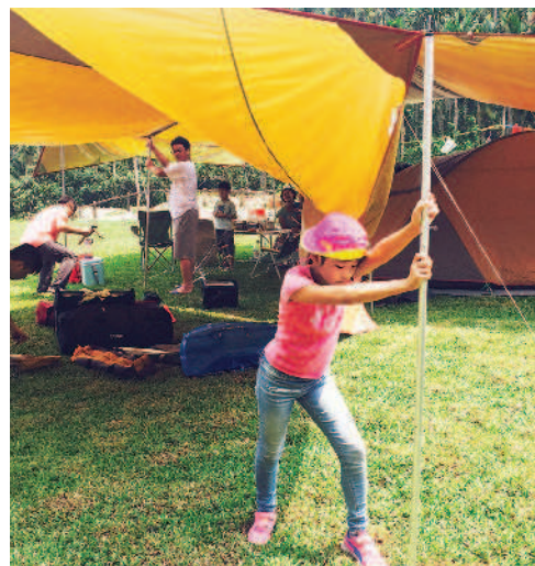
▲小朋友學習搭建遮雨遮陽的天幕帳。

另外，架帳前要先清除地面的石頭雜物，以免睡覺時背部被雜物頂著睡不好；帳棚的紗門也要記得隨手拉好，如果蚊子飛進去麻煩可大了。