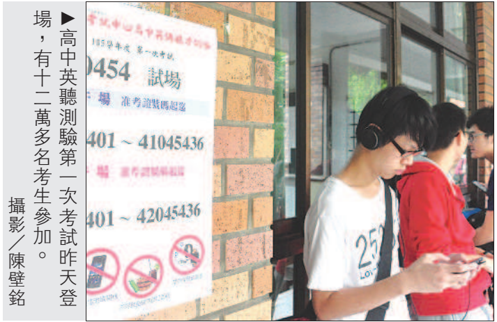
►高中英聽測驗第一次考試昨天登場，有十二萬多名考生參加。