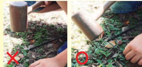
▲營釘要與地面保持四十五度角再插入，帳棚更牢固。

盆該帶的也別忘了。有些營地甚至沒有乾淨水源，要自己準備。燃料也要考慮，是要帶汽化爐或瓦斯爐，還是要以土石搭灶，現場撿拾柴火。 最後教小朋友搭帳的一個小秘訣：固定營繩用的營釘，要與地面保持四十五度角再插入土裡，會比較