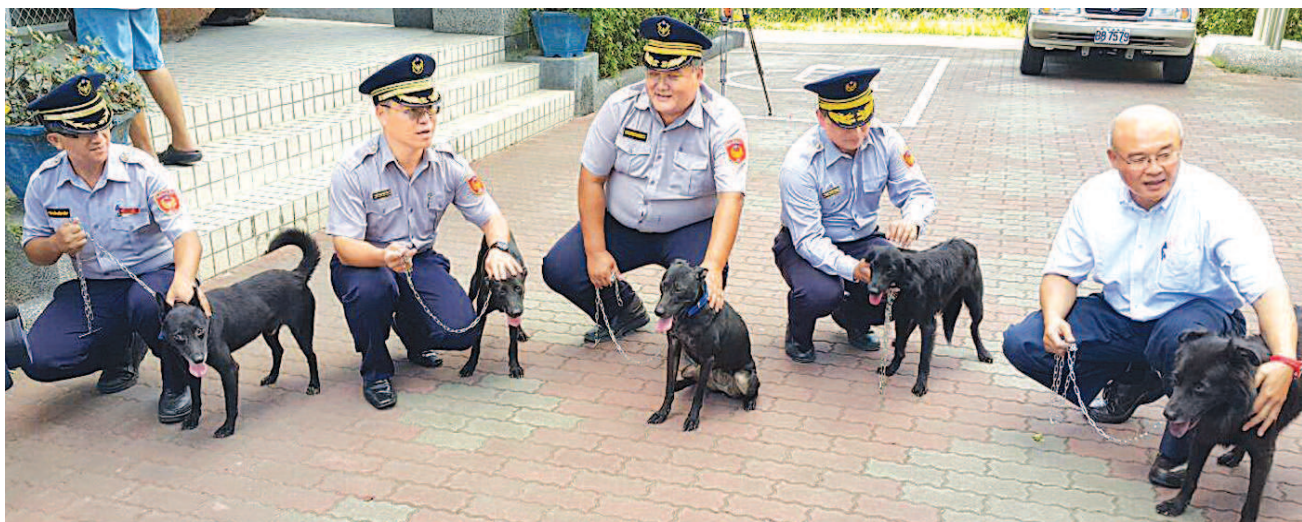
►五個關山警分局巒山派出所的生力軍和主人合影。