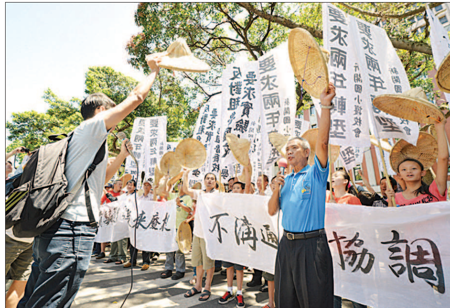
▲苗栗縣大湖鄉百年老校新開國小，面臨廢校命運，三百多名村民組成「新開國小護校會」，北上教育部陳情。

王詣筑、楊惠芳、張彩鳳／連線報導 苗栗縣新開國小當地村民為反對縣政府的學校整併廢校政策，昨天先到苗栗縣府抗議，隨後北上到教育部陳情。村民頭戴斗笠，手持白布條，痛批縣府「粗魯廢校」、「違反程序正義」，希望縣府能給學校兩年時間轉型。