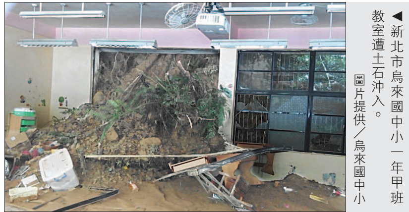
▲新北市烏來國中小一年甲班教室遭土石沖入。

烏來區嚴重災情，烏來國中小因邊坡坍塌，一棟校舍遭土石流沖入；新店區龜山國小水淹一層樓高。不過，新北市教育局昨天表示，將會如期開學，不影響學生受教權益。 教育局長龔雅雯表示，這次風災受影響最嚴重的是烏來區和新店區，重大災損學校包括烏來國中小及龜山國小。此外，烏來國中小、福山國小和三峽區有木國小因道路中斷影響通學，各局處正全力搶修，並協助學校復原。