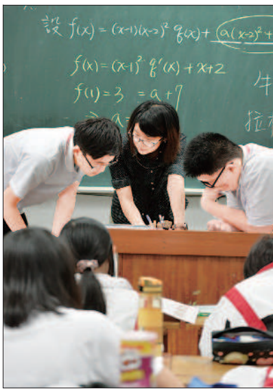
▲十二年國教政策推行後，高中差異化教學更形重要。攝影／高修民

十，成績從常態分布變成雙峰，中段學生不見了！」她表示，教師教學方式可能要更精準。 宜蘭高中教務處表示，一年級新生中約有百分之五參與補救教學，由教師評量學生學習表現或學生自認有需求都可以參加，以國英數三科為主，頻率為每一週到兩週一次。 臺北市萬芳高中教務處表示，課後補救教學已辦兩年，以一年級新生為上課對象。學生成績符合補救教學標準，將發意願調查表讓學生決定是否參與。補救科目以英數為主，一週一次，一學期十週。 為了提升國中會考待加強同學的國英數三科成績，教育部開辦學生學習扶助計畫。桃園市觀音高中去年開辦高一補救教學措