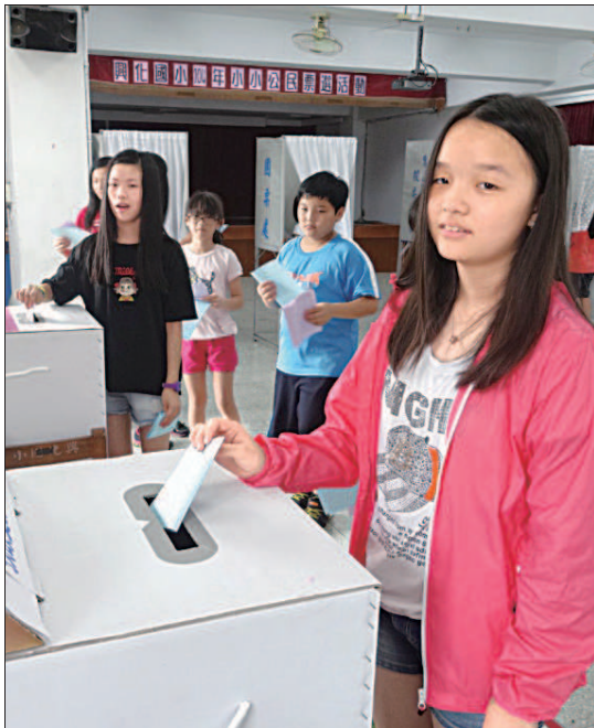
▲新北市興化國小昨天舉辦小小公民投票活動，由全體學生票選出最喜歡的書籍，以及最重要的兒童權。

楊惠芳／新北報導 小朋友認為最重要的兒童權是什麼？新北市興化國小昨天舉行「小小公民投票活動」，由全體學生針對主題「書展和兒童權利公約內容，投票選出個人認為「最喜愛的書籍」及「最重要的兒童權」。 結果兒童權方面，多數低年級和中年級學生選的都是「不可以傷害我們」。 興化國小校長周崇儒表示，活動中，全校三百多名學生都投下神聖一票，表達個人看法，體驗公民社會的「參與權」。