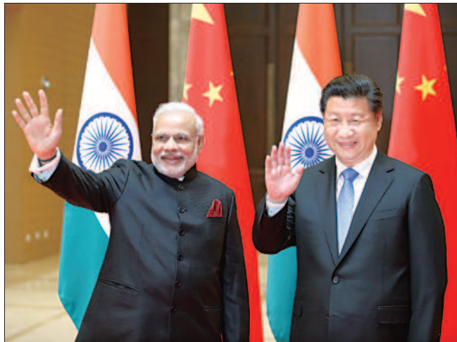
中印合作 印度總理穆迪（左）前天展開拜訪中國的三天行程，和中國國家主席習近平（右）在西安會面。昨天雙方正式簽署了總額達美金一百億元的二十四項合作協議，內容涵蓋基礎建設、教育、管理海洋事務及研究海洋科學等。穆迪表示，中印都是亞洲人口大國，應捐棄成見，進行合作。

林人芳 / 臺北報導 立法院院會昨天三讀通過《長期照顧服務法》，確立長照制度法源，並整合長照服務資源。未來只要身心失能六個月以上，需要生活和醫事長期照顧者，家屬即可透過長照機構聘僱受過訓練的長照人員或外籍看護。這項新法將在公布兩年後施行，預計有七十六萬個失能者及其家庭受惠。 新通過的《長期照顧服務法》，取消對接受服務者的年齡限制，只要身心持續失能達六個月以上，身心功能部分喪失或全部喪失者，都可申請長照服務，並以居家、社區、機構住宿或家庭服務模式，得到最佳照顧；政府也應提供長照知識與技能訓練。 新法也將家庭照顧者和外籍看護納入服務規範範疇，未來家屬除了可自行聘僱外籍看護，也可向居家式長照機構申請；機構須負責管控品質，如果外籍看護請假或休息，機構應派人替補。 立法院院會也三讀通過《勞動基準法》部分條文修正案，將現行法定工時由雙週八十四小時，縮短為單週四十四小時，形同全面實施週休二日。新法自明年元旦起實施。