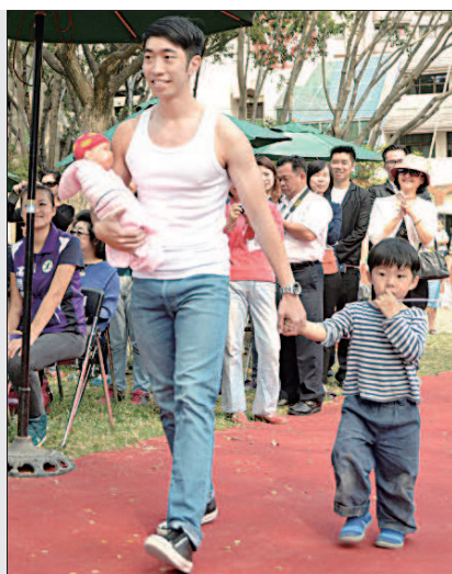
►高雄市主辦「型男照顧時尚走秀」，打破傳統性別窠臼。

日前舉辦活動，將焦點關注在男性身上，以「鼓勵男性參與照顧工作」為訴求，透過「型男照顧時尚走秀」呈現多樣化的男性角色，打破傳統性別窠臼，倡導性別平權。