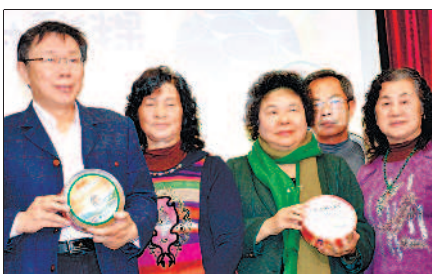
▲臺北市長柯文哲（左一）和高雄市長陳菊（左三）代言小林村甜粿，幫忙推銷。

二〇〇九年莫拉克颱風幾乎摧毀高雄小林村，當時全村六百多人，僅倖存四十多名。六年來，村民努力重建家園，也自食其力，想辦法賺錢，不再依靠外界捐款。十一名村民在「綠色逗陣工作室」協助下，製作過年必吃的甜粿，進行販賣。昨天，臺北市長柯文哲和高雄市