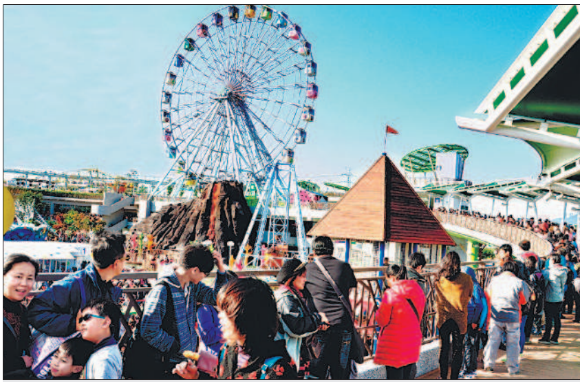
▲臺北市兒童新樂園昨天人潮爆滿，除了進門大排長龍外，遊客最喜歡的摩天輪，排隊必須超過一個小時以上。