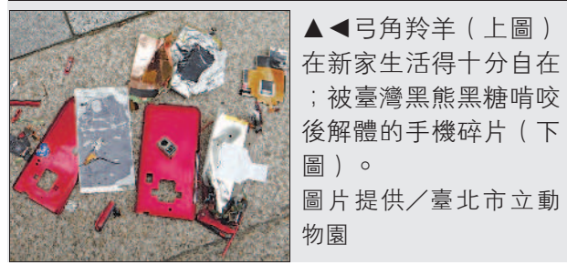
▲◀弓角羚羊(上圖)在新家生活得十分自在；被臺灣黑熊黑糖啃咬後解體的手機碎片(下圖)。